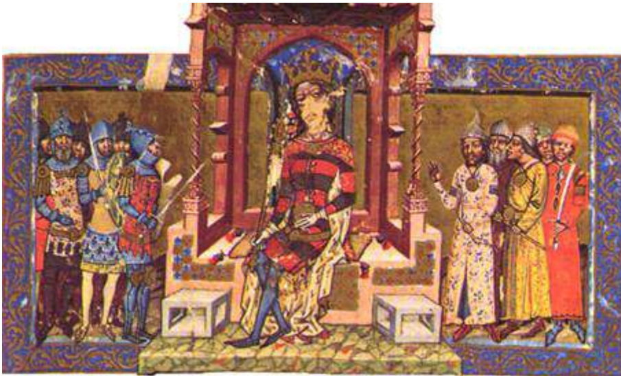
Illustration d'ouverture de la Chronique Enluminée ( Chronicum Pictum conservée à la Bibliothèque Nationale Széchényi à Budapest, cote Clmae 404, f.1.)

populations qui arrivent dans le bassin des Carpates. Sédentarisés et dotés d'un royaume à préserver, les Hongrois vont sans doute renouveler l'usage des tribus allogènes qu'ils avaient connu lorsqu'ils étaient eux-mêmes au service des Khazars. Les mouvements de troupes ne sont pas nécessairement le reflet de migrations de groupements ethniques. On le voit assez clairement en suivant les mentions de Petchenègues et de Sicules, ensemble à la frontière occidentale dès le XII e siècle, alors théâtre principal des opérations militaires. Puis ceux que les sources appellent Petchenègues semblent demeurer proches du pouvoir royal tandis qu'au XIII e siècle, ceux que les sources appellent Sicules apparaissent concentrés sur la frontière orientale de la Transylvanie. « Ceux que les sources appellent », la formule est quelque peu alambiquée, mais il n'est pas inutile d'exprimer la diversité des parcours des groupes de cavaliers qui formeront les Nations médiévales dotées de privilèges.