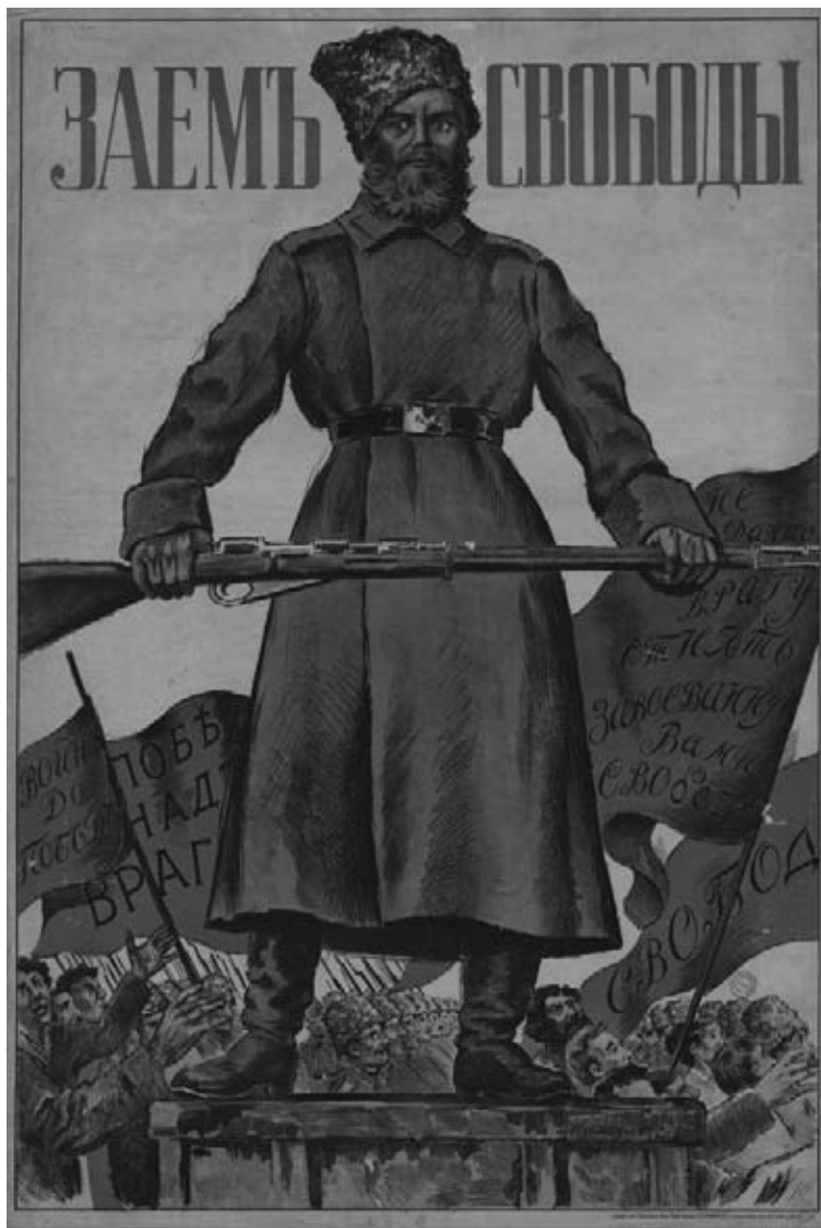
B. Koustodiev, Emprunt de la liberté [affiche pro-révolutionnaire], 1917. Coll. BDIC

Une autre référence importante dans l'analyse des photographies est l'histoire familiale. Pendant très longtemps, la Première Guerre mondiale fut un sujet plus ou moins tabou, et dans de nombreuses familles cette mémoire n'a pas été transmise. Néanmoins, ceux qui connaissent l'histoire de leur famille, ou ceux qui regrettent