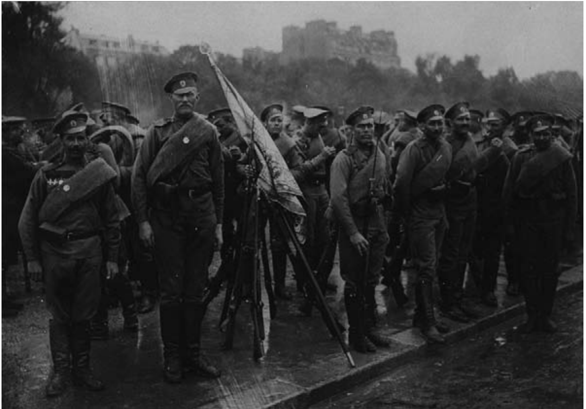
Paris. Fête du 14 juillet 1916. Esplanade des Invalides. Soldats russes et leur drapeau avant la revue.