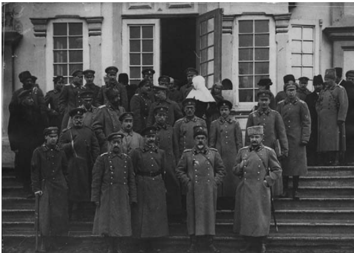
Ekaterinodar. Le général Denikyne et son état-major (printemps 1918).