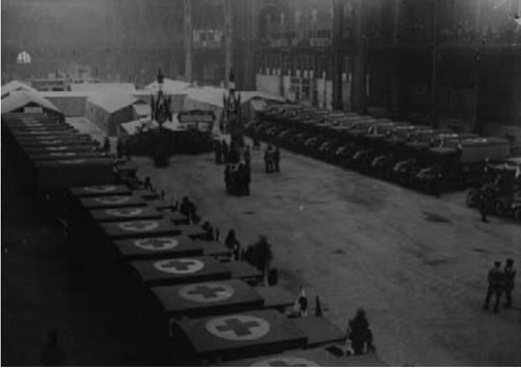
Paris. Au Grand Palais. Exposition d'auto-ambulances destinées à la Russie (11 mai 1917). Coll. BDIC