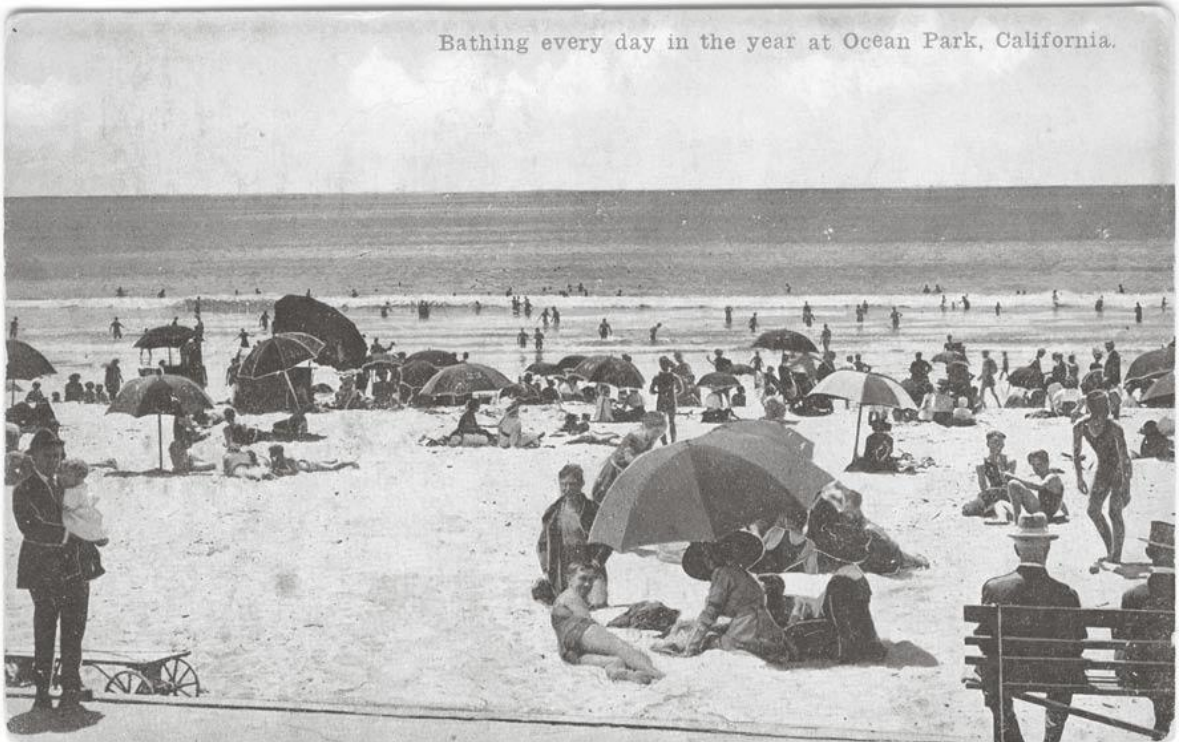
La plage d'Ocean Park à Santa Monica en 1915. Si certaines personnes sont en tenue de ville, la plupart des gens présents sur le sable sont désormais en maillot de bain. Toutefois, il est difficile de dire où s'arrête la plage et où commence la ville : ainsi la promenade en bois (visible au premier plan) appartient-elle au monde de la ville ou à celui de la plage ?