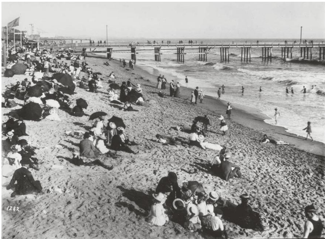
La plage de Santa Monica en 1908. À cette époque, la plupart des gens restent habillés sur la plage.