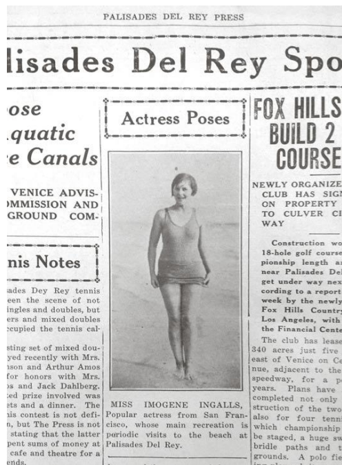
L'actrice Imogen Ingalls pose sur la plage de Del Rey.

Les membres d'un club de privé se délassent sur la plage dans des maillots de bain typiques du milieu des années 1920. Les maillots sont plus près du corps et ils dévoilent les épaules et les cuisses des baigneurs comme des baigneuses. « Casadelmar Topics », vol. 1, no 6, août 1925, p. 9, carton no 9, dossier no 16, California Tourism and Promotional Literature Collection, Oviatt Library, California State University Northridge.