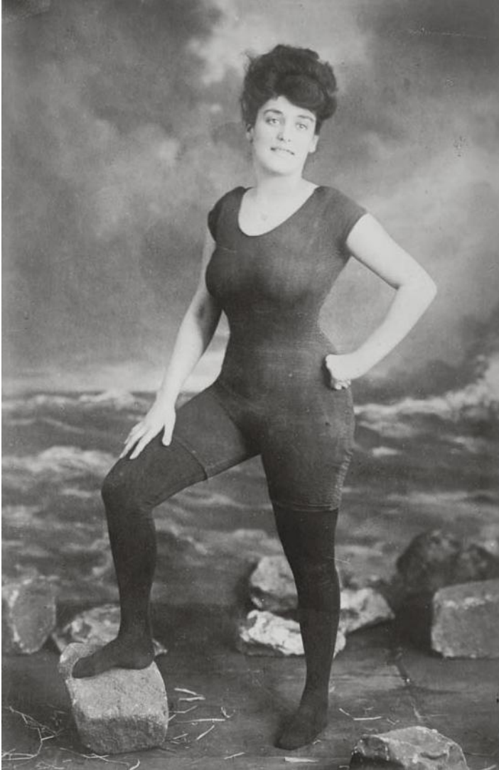
Annette Kellerman prend la pose dans son fameux maillot de bain noir une-pièce (1919). Celui-ci lui vaudra d'être arrêtée sur la plage de Revere Beach, près de Boston, Massachusetts, en 1907.

se dotent d'un bonnet et de collants 12 . Mais dans d'autres villes, comme à Santa Monica, on estime qu'une ordonnance n'est pas nécessaire et que chaque baigneur doit faire appel à son sens de la retenue 13 . Autrement dit, la règle est imposée soit de manière formelle, soit de manière informelle, par le biais de la pression collective. Par ailleurs, il faut préciser que les tenues prescrites sont pensées uniquement pour la baignade : sur les photographies du début du siècle, la plupart des personnes présentes sur la plage (allongées ou assises) demeurent habillées. En effet, à la sortie de l'eau, il est entendu qu'un baigneur doit se rendre à l'établissement de bains où il pourra se laver et se changer en tenue de ville. Cette règle n'est pas toujours respectée : certaines personnes se changent sur place en tentant de se dissimuler du regard des autres baigneurs, au risque de se faire arrêter par la police 14 . Mais la plage, et a fortiori ses alentours, reste un espace où l'on est vêtu comme à la ville.