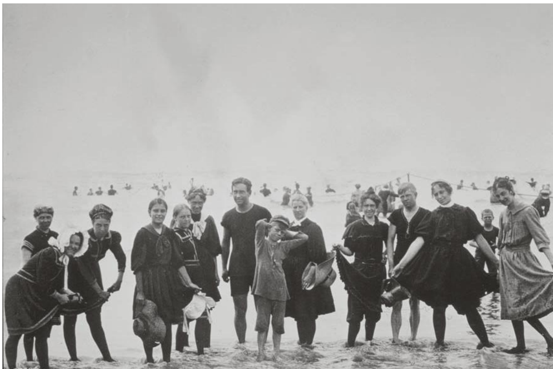
Des baigneurs sur la plage de Santa Monica en 1910. Les femmes portent une robe large et des collants ; certaines d'entre elles portent même un bonnet de bain pour couvrir leurs cheveux. Les hommes portent une tenue qui couvrent leurs épaules et descend jusqu'aux genoux.