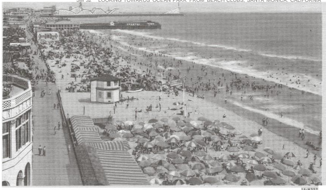
Carte postale représentant la plage d'Ocean Park à Santa Monica. À l'arrière plan, on distingue l'une des nombreuses zones foraines de la côte.