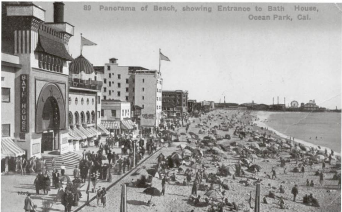
Panorama de la plage d'Ocean Park montrant l'établissement debains.