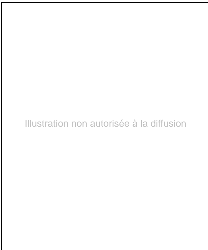
Fig. 1. Vue d'ensemble de la stèle.