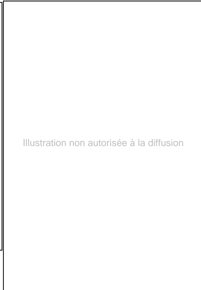
Fig. 2. Face A.