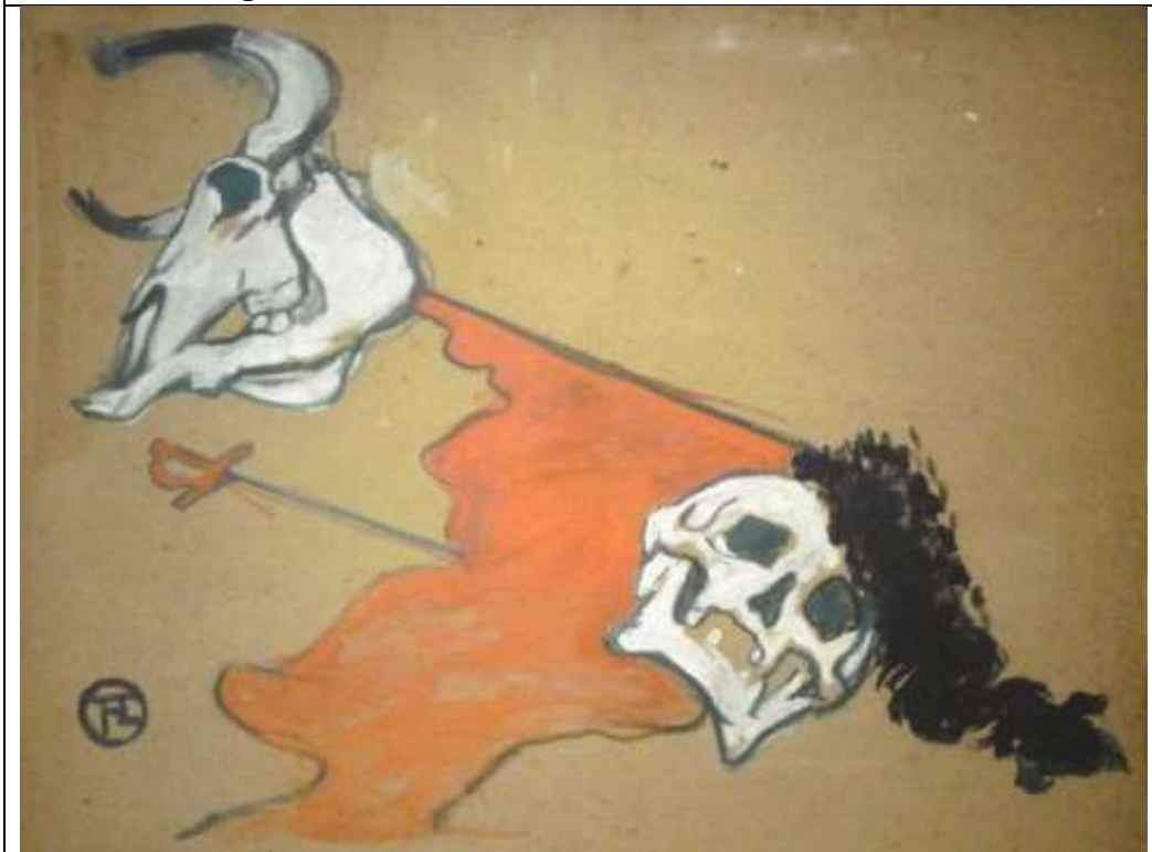
Image 9 : H. de Toulouse-Lautrec, Tauromachie Image du domaine public, photo réalisée en 2009, au moment de l'exposition faite au Grand Palais lors de la dispersion de la collection de Pierre Bergé et Yves Saint Laurent.

deux matadors venaient de succomber, il confirme son point de vue : « Les morts dramatiques de Paquirri et du Yiyo ont renoué avec la vérité de la mort. [...] quand un type est tué par un taureau, cela apporte toujours quelque chose. [...] Dans le fond cette putain de mort nous attire. Si ici on ne mourait pas pour de vrai, que feraient tous ces gens dans les arènes ? » (Zumbiehl, 2004 : 49). Le journaliste P. Veilletet (1986 : 138) commente : « le calvaire du plus beau, du plus glorieux, du plus riche des matadors de sa génération a servi le mystère tragique de la corrida, à un moment où le prosaïsme la guettait. Il fallait donc pleurer Paquirri, victime et preuve. » Comme les catholiques ont régulièrement besoin de miracles, les aficionados ont régulièrement besoin de voir que les matadors meurent aussi 16 .