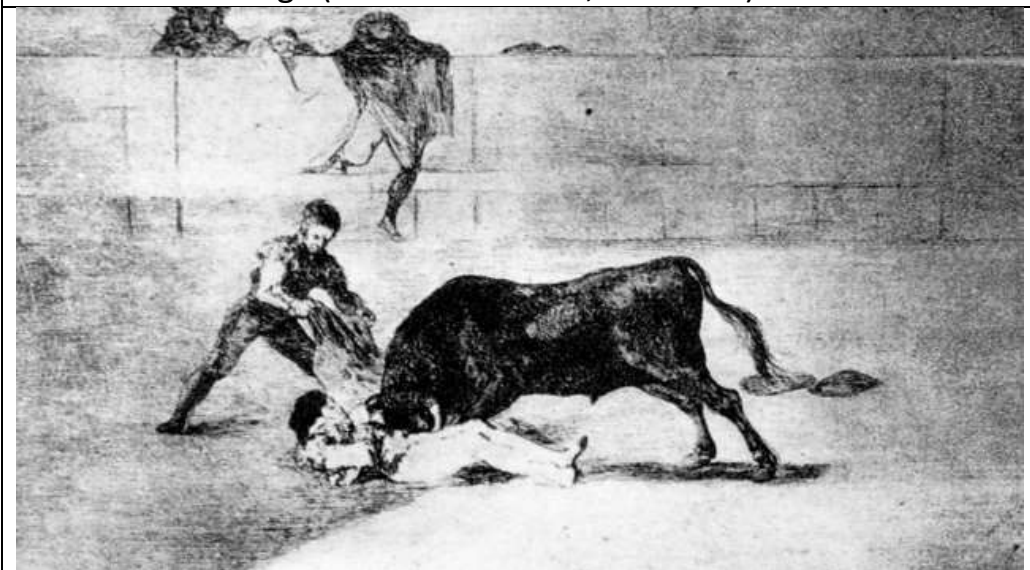
Image 4 : F. de Goya, La mort de Pepe Hillo (Martinez-Novillo, 1988 : 69)

Les peintres qui ont croqué des scènes de tauromachie ne se sont pas contentés de représenter des passes 13 à la cape ou à la muleta à coup sûr porteuses l'une et l'autre d'une esthétique singulière. Les plus grands ont choisi de représenter aussi, à un moment ou à l'autre, la mort du matador.