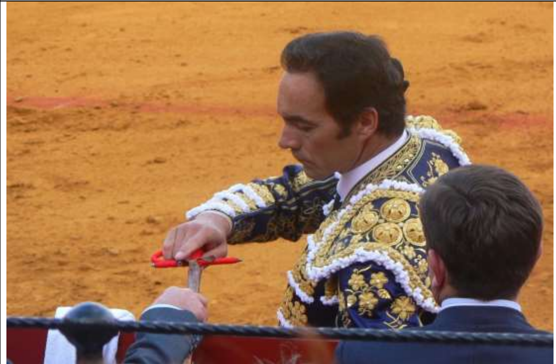
Image 2 : comme l’amant qui s’interrompt pour prendre un préservatif, le matador se détourne pour changer d’arme

Ce marquage du début de « la minute de vérité » est redoublé par le fait que l’orchestre cesse de jouer ; les gradins se font silencieux. C’est que va être mis à mort un taureau qui vient de faire montre de ce que les aficionados appellent « bravoure », « noblesse »... façons d’attribuer à un animal des qualités humaines.