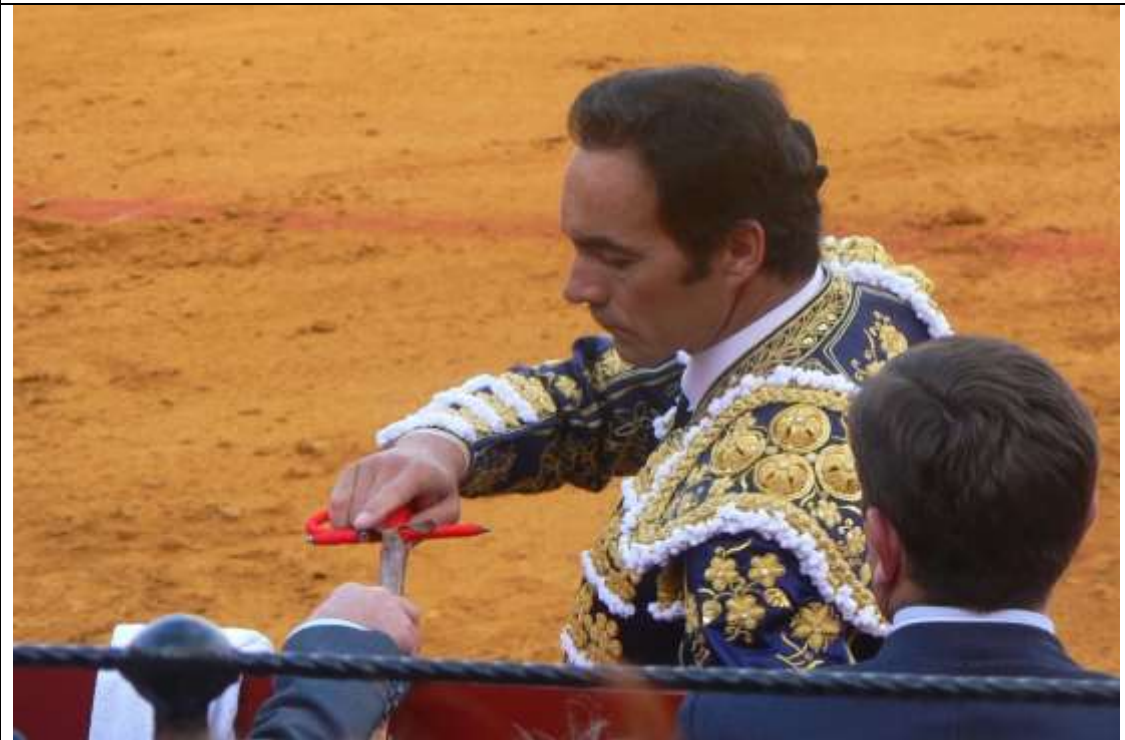
Image 2 : comme l'amant qui s'interrompt pour prendre un préservatif, le matador se détourne pour changer d'arme

Ce marquage du début de « la minute de vérité » est redoublé par le fait que l'orchestre cesse de jouer ; les gradins se font silencieux. C'est que va être mis à mort un taureau qui vient de faire montre de ce que les aficionados appellent « bravoure », « noblesse »... façons d'attribuer à un animal des qualités humaines.