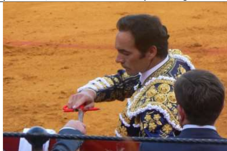
Image 2 : comme l’amant qui s’interrompt pour prendre un préservatif, le matador se détourne pour changer d’arme

Le script de la lidia a évolué depuis le XIX e siècle. On y distingue toujours trois tiers, le matador devant, lors du troisième, tenir une épée à la main. Or, depuis les années 1920, le développement de « l’art de toréer » a considérablement allongé la durée de ce troisième tiers : jusqu’à dix minutes. Devoir tenir aussi longtemps à la main une épée d’acier s’est révélé, sur le plan pratique, un handicap ; aussi, à partir de 1960, de plus en plus de matadors fournissaient un certificat médical (indiquant une faiblesse au poignet) pour qu’il leur soit permis de n’utiliser qu’une épée allégée (souvent en aluminium) dite estoque simulado . Tant et si bien qu’en 1992, un Real decreto stipule que tous les matadors, même sans certificat médical, peuvent démarrer ce troisième tiers avec une arme fictive, légère, et ne l’échanger contre une épée d’acier qu’au tout dernier moment. Ce faisant, la mise à mort se trouve mise en exergue. Il est singulier d’observer que c’est à l’époque où l’usage du préservatif est intégré dans le répertoire sexuel courant – introduisant une séparation entre les caresses préliminaires et le moment où le couple envisage la pénétration sexuelle – que l’on voit pareille interruption juste avant la pénétration de l’épée.