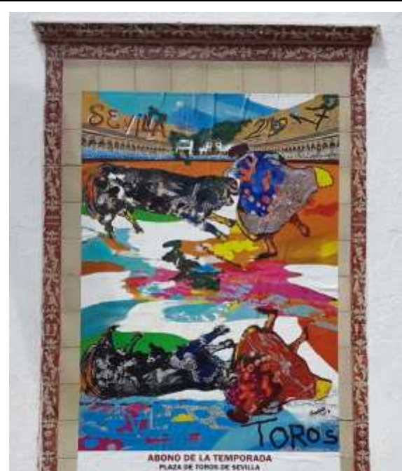
Image 11 : sur cette image d’affiche de « feria » sur un mur de Séville, le reflet montre un taureau et un torero renversés, ce dernier étant revêtu couleur sang

« Ce que met en scène la corrida, c’est peut-être l’ajustement, l’alignement, la recherche d’un accord entre deux acteurs de Grotowski, deux artistes du dévoilement, deux servants du sacrifice tauromachique : le taureau et le torero » (Roux, 2011, p. 150-151).