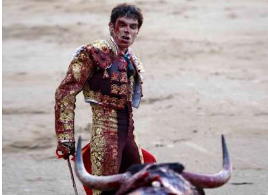
Image 8 : photo d'un matador sanguinolent très diffusée (tant par les aficionados que par les militants anti-corrída) qui n'est pas sans rappeler certaines représentations de la passion du Christ, notamment un film de Mel Gibson quelques années auparavant

(Antonio Lorca, 2008, p. 26)