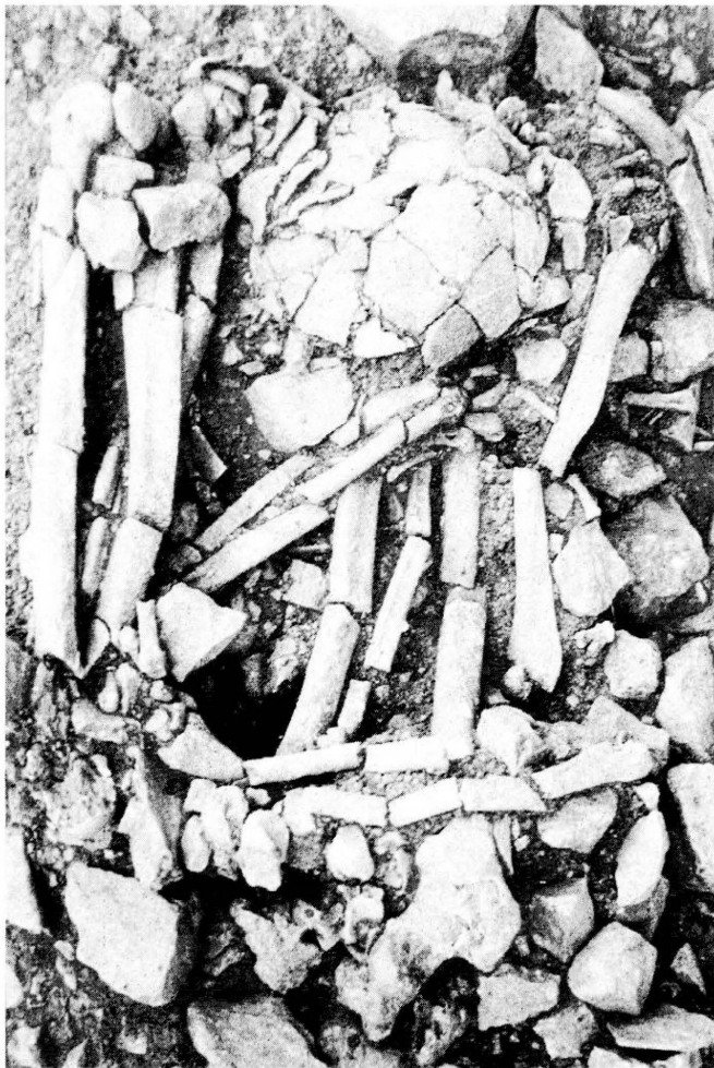
Fig. 2 : Sépulture primaire H154, fouillée en 1997, d'un homme inhumé sur le dos avec les membres inférieurs, en flexion forcée, ramenés au-dessus du thorax; l'étude taphonomique a montré que des moyens de contention avaient été utilisés lors de l'inhumation (BOCQUENTIN in VALLA et al., 1998).

fien final 16 (fig. 2). En revanche, l'essentiel du matériel étudié, qui provient des fouilles anciennes, se répartit dans les trois phases natoufiennes qui couvrent environ une période d'occupation du site de 1 500 ans. Cependant cette occupation est probablement discontinuée, tout au moins dans ce secteur du village. Bien qu'elle ait bénéficié d'une étude morphométrique détaillée 17 , la population issue des premières fouilles n'a pas fait l'objet d'un inventaire clair : le dénombrement oscille entre 80 et 120 individus dans la publication la plus récente 18 . C'est pourquoi, nous avons repris l'étude ostéolo-