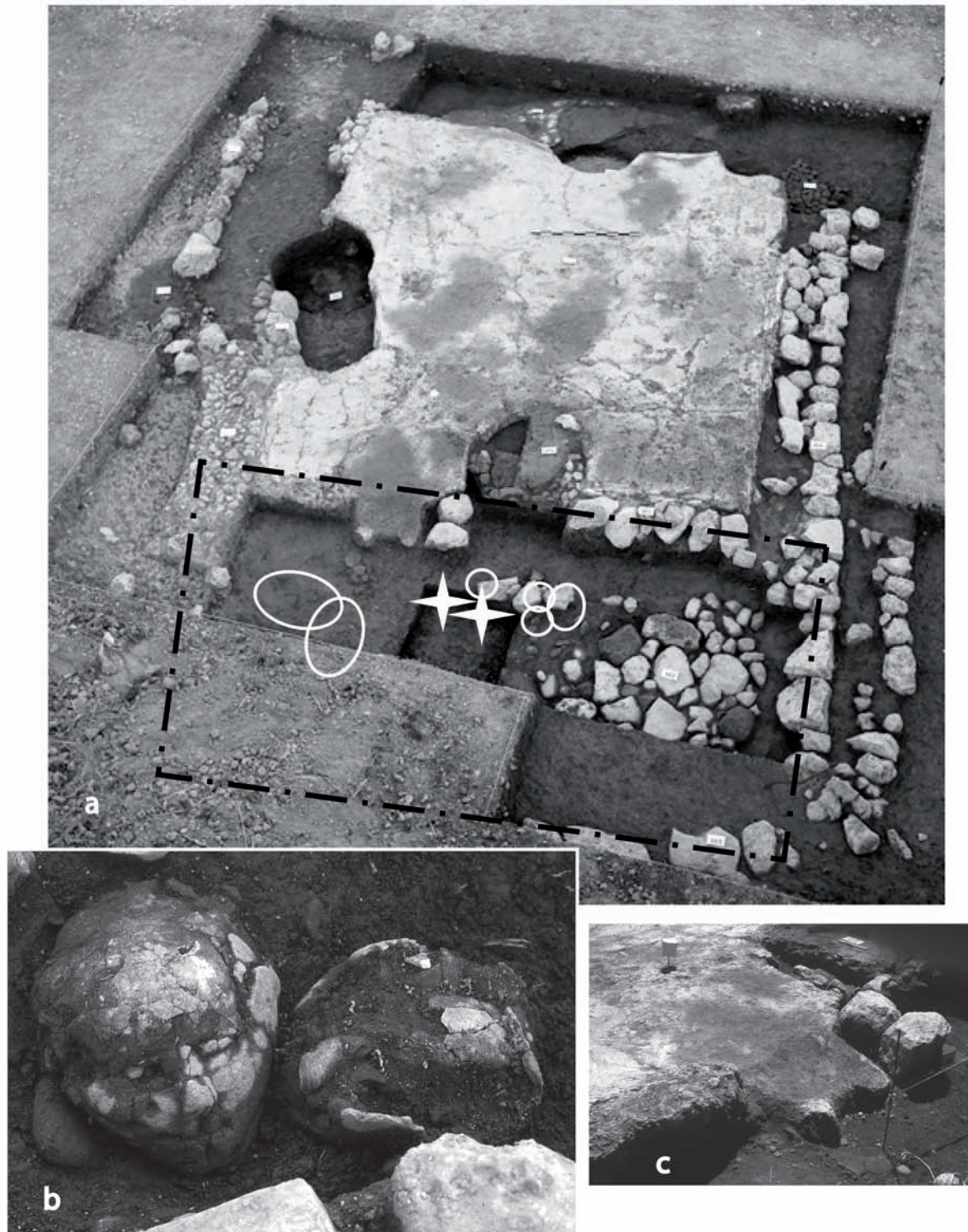
Figure 4 : a. Vue de la maison 150 depuis l'ouest : l'antichambre est en cours de dégagement, les crânes surmodelés (étoiles) ont été prélevés en bloc. Les sépultures 188 et 197 n'ont pas encore été mises au jour (leur emplacement est figuré par des cercles blancs) (d'après Lechevallier 1978 : 138, planche XXV). b. Crânes 1 et 2 in situ (photographie prise de l'est) (d'après Lechevallier 1978 : 151, planche XXXI). c. Détail du passage aménagé entre la pièce principale et l'antichambre dans son état final.