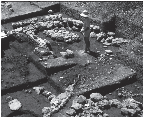
Figure 5 : Antichambre vue du nord-est, les sépultures 188 et 191 (sous le sol plâtré de la pièce principale) sont en cours de fouille. Notez le lambeau du sol enduit le plus ancien qui est préservé au niveau de la jonction des deux espaces. Le dénivelé est mineur par rapport à ce qui a été observé au début de la fouille (fig. 4c).

était, au début de son occupation, peu voire non compartimentée. Mais par la suite, les 2/3 est du sol enduit ont été régulièrement rénovés alors que la partie la plus à l'ouest était laissée telle quelle de sorte que le décalage altimétrique entre ces deux aires s'est accentué jusqu'à ce que l'aménagement d'une petite rampe soit nécessaire pour faciliter la circulation (fig. 4c). Le bourrelet de plâtre et le muret ont pu être aménagés afin de soutenir un dénivelé croissant. Il semble qu'il y ait eu une volonté de préserver de façon durable l'organisation initiale de la partie ouest de la maison, là où se trouvaient les crânes.