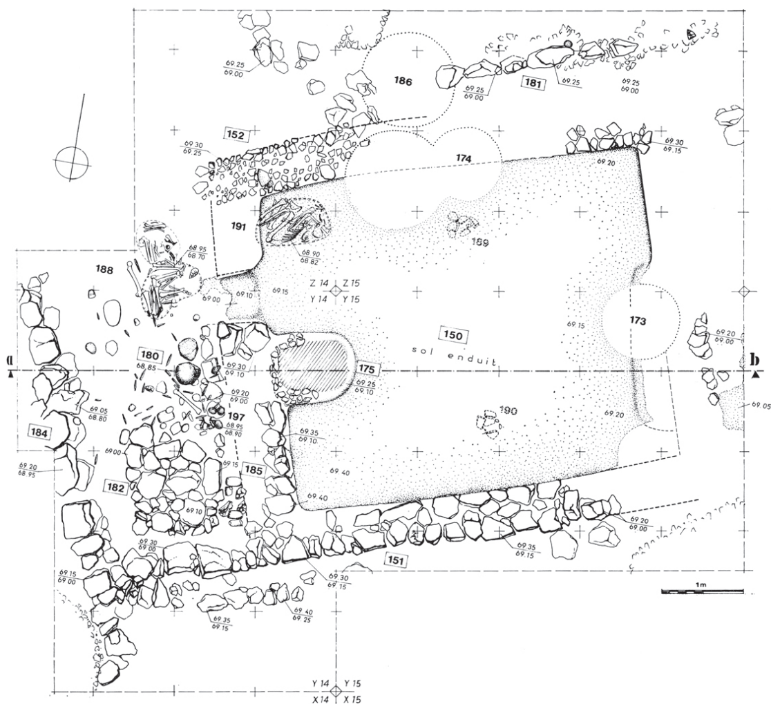
Figure 1 : Plan de la structure 150 (pièce principale enduite et antichambre qui la prolonge à l'ouest) et des locus annexes. Notez la présence des crânes surmodelés (locus 180) et de la double fosse sépulcrale (locus 188) à proximité du passage entre ces deux espaces. D'après Lechevallier 1978 : 135, fig. 47).

moyen 10 s'y succèdent : -niveau 3, vestiges de sol et bassins enduits ; -niveau 2, aire probablement ouverte comprenant foyers et fonds de cuvette ; -niveau 1, habitation à sol enduit et structures annexes (locus 150 : fig. 1). Ce niveau, le plus récent et le mieux conservé, a livré les deux crânes surmodelés.