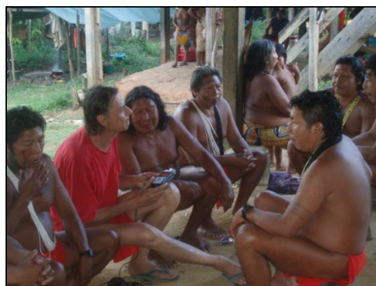
Un atelier à Trois-Sauts, août 2014.

- Le CREM (Centre de Recherche en Ethnomusicologie – LESC CNRS, Université Paris Nanterre), directrice Aurélie Helmlinger.