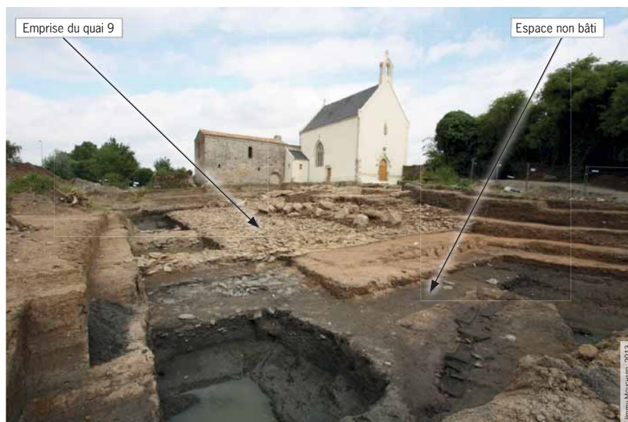
Figure 2. Rezé, Saint-Lupien. Vue du quai 9 après décapage et de l'espace non bâti (« vasière ») sur sa frange occidentale.

La découverte en 2013 d'un secteur non bâti – à l'ouest du quai n° 9 – conservant des archives sédimentaires a donc permis de développer un ensemble d'études paléoenvironnementales particulièrement importantes. Localisé au sein du secteur 16, cet espace non bâti – dénommé « vasière » (figure 2) – présente les aspects d'une plage de sable, telle qu'il s'en rencontre encore aujourd'hui dans l'estuaire, et qui s'est progressivement envasée/ensablée durant l'Antiquité. Ce secteur oriental fournit, un peu à la manière des bassins portuaires conservés en Méditerranée (GOIRAN & MORHANGE, 2001), un lot d'archives sédimentaires piégées dans un espace plus ou moins clos, tout du moins ici en retrait. Déposé sur 2 m de stratigraphie, depuis le substrat jusqu'aux derniers remblais de l'Antiquité tardive, ce secteur présentait un potentiel paléoenvironnemental conséquent, puisqu'approchant les 40 m x 30 m, donc une surface de 1 200 m 2 , soit près de 2 500 m 3 de volume sédimentaire.