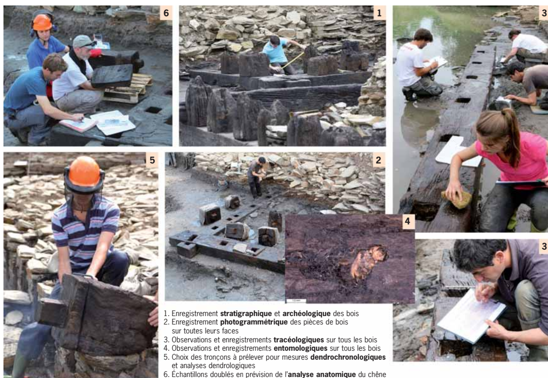
Figure 5. Rezé, St-Lupien. Gestion et organisation des temps d'intervention autour du matériau « bois » (Réalisation J. MOUCHARD).