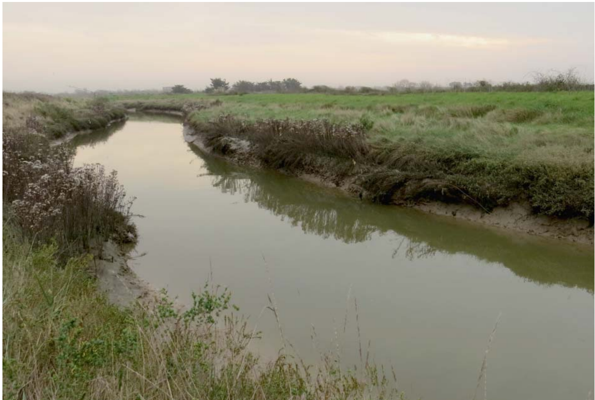
Fig. 2 – Le chenal du ruisseau de l'Île Bernard dans les marais de Talmont sur le site de capture des juvéniles d'Alose feinte