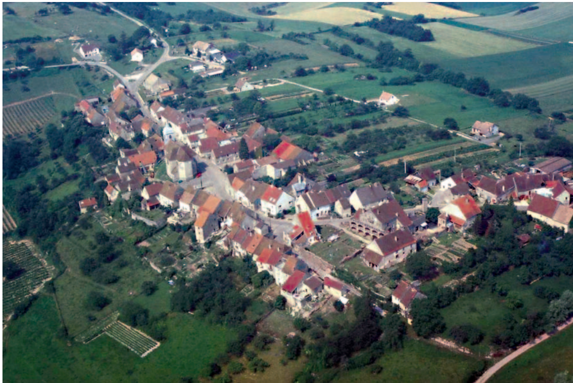
Le village d'Offlanges (Jura).

Postdoctorante en archéogéographie, université de Coimbra-Porto (Portugal), CEAUCP/FCT, UMR 7041 ArScAn, équipe « Archéologies environnementales »