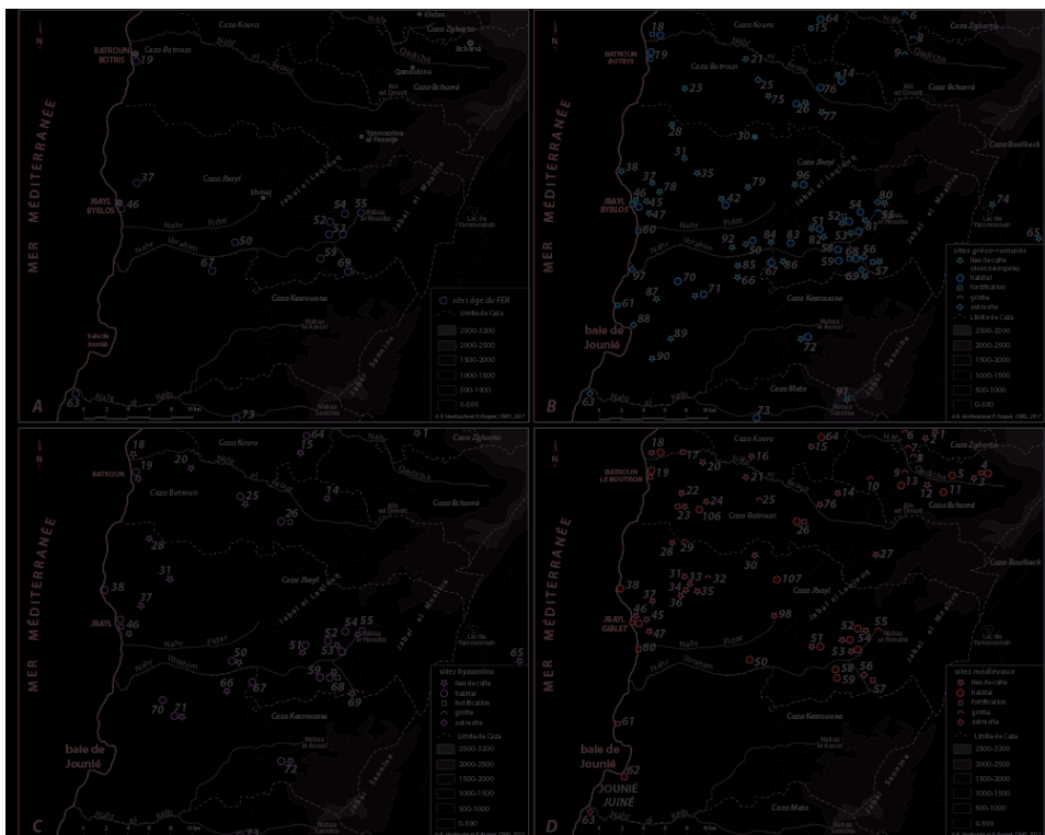
(A) Carte des sites de l'âge du Fer. (B) Carte des sites gréco-romains. (C) Carte des sites byzantins. (D) Carte des sites médiévaux, ne comprenant pas les casaux.

Crédits : R. Harfouche et P. Poupet, Cnrs 2017