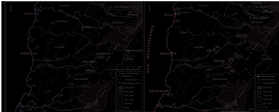
À gauche, carte des principaux sites connus du Néolithique et du Chalcolithique entre le Nahr el-Kelb au sud et le Nahr ej-Jaouz au nord. À droite, carte des sites de l'âge du Bronze

Crédits : R. Harfouche et P. Poupet, Cnrs 2017