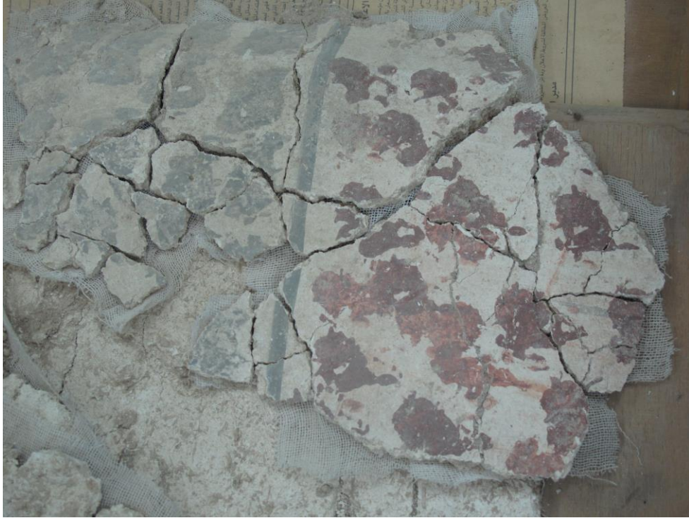
Fig. 4 : Fragments de plinthe à décor architectural d'appareil de pierre (n° provisoire 110), montrant côte à côte un bloc rectangulaire tacheté de rouge et un tacheté de noir. En attente de nettoyage et de restauration dans la salle de travail de la maison de fouille.