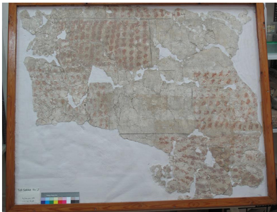
Fig. 2 : Fragments de plinthe à décor architectural d'appareil de pierre provenant du mur nord du loc. 5 (n° provisoire : plaque 1). La hauteur conservée dans le passage 6-5 était de 1,20 m. Restauration Faez Sewed. Conservés dans la maison de fouille.