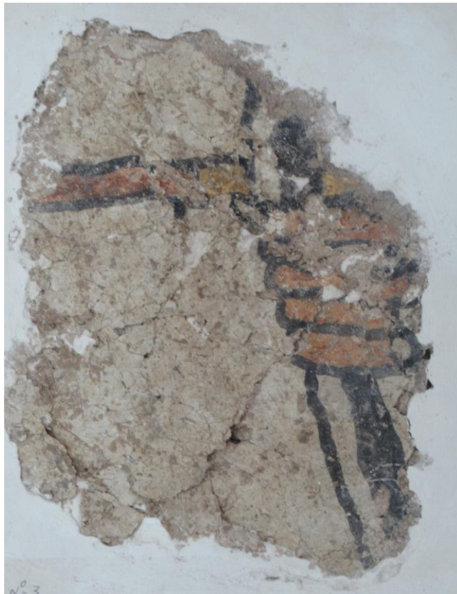
Fig. 5 : Fragment de peinture murale figurative (fouille 1995, n° provisoire : plaque 13) : main bandant un arc. Restauration Faез Sewed. Conservé dans la maison de fouille.