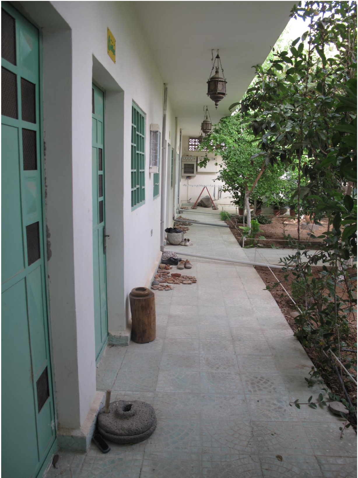
Fig. 1 : La maison de fouille avec son jardin central, du côté des chambres.