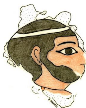
Fig. 3 : Fragment de peinture murale figurative dénommé « le gentilhomme », recueilli dans le remplissage du loc. 5 (carré 25/28), à 80 cm au-dessus du sol. Problème stratigraphique (mélanges ?) dans la mesure où ce remplissage est daté du Bronze récent alors que le palais et ses peintures appartiennent au Bronze moyen. a - Le fragment nettoyé et enchâssé dans une plaque de plâtre moderne par Faez Sewed (n° provisoire : plaque 3). Conservé dans la maison de fouille. b - Dessin du fragment par Ahmad Firzat Taraqji.