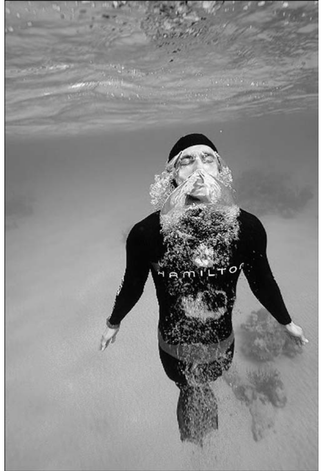
3. Remontée en surface, Bahamas, 2006.

ne pas avoir peur de ce qu'il y a dans l'eau : les méduses, les poissons, etc. On n'a peur que de l'inconnu. Dès que tu connais, que ce soit un milieu ou toi-même, tu n'as plus peur. Par exemple, lorsque j'étais enfant et que j'étais à la pêche au thon avec mon père à quarante