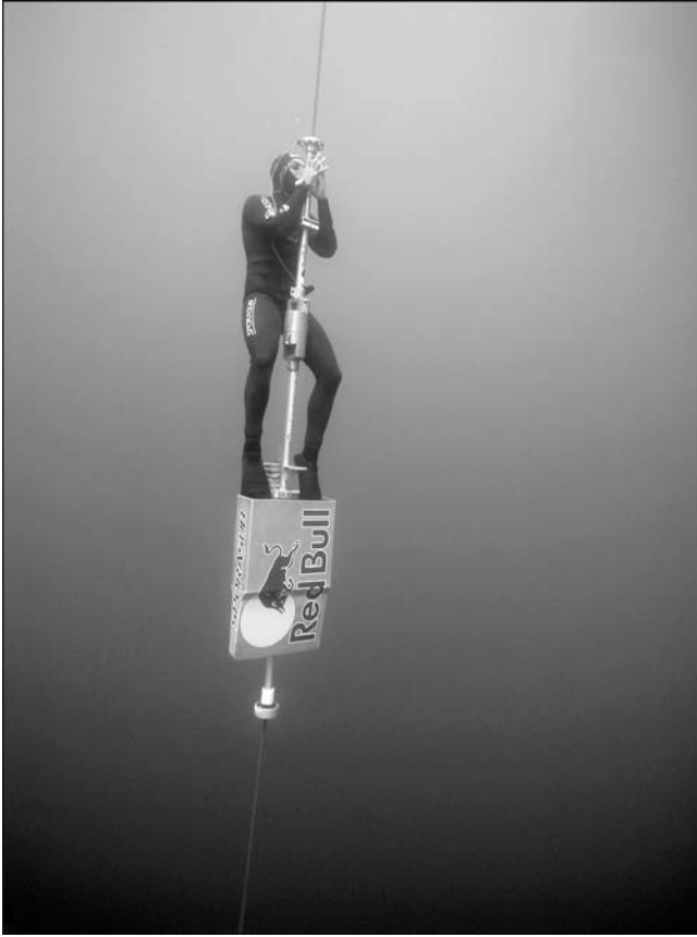
2. Descente officielle de record du monde 2004, à 123 m en poids variable, Bahamas, 2006.