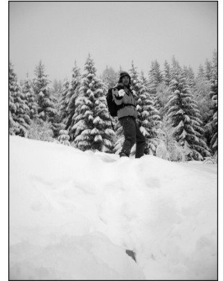
7. Randonnée à ski en Vanoise, France, 2006.

Enfin, les photographies qui illustrent les articles de ce numéro sont éloquentes. Elles sont bien souvent d'une beauté et d'une amplitude à « couper le souffle », selon l'expression consacrée 12 . C'est dire explicitement l'intensité des émotions et des sentiments engagés dans ces pratiques. Pour autant, elles n'empêchent nullement la pensée. Au contraire, elles sont une invite à l'exploration du « corps » du risque et de la condition humaine, et renvoient chacun de nous aux limites fixées dans l'accomplissement de son existence, limites que nous sommes parfois conduits à dépasser. Le risque fait vivre, il n'est pas uniquement une figure de la négativité. C'est bien parce que rien n'est jamais assuré que le goût de vivre accompagne notre relation au monde. Au regard des contributions, nous serions tentés de dire que le risque et l'incertitude ne servent pas tant à relever le goût, mais qu'ils sont le goût lui-même. ■