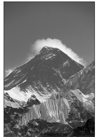
2. Éverest, Népal, 1986.