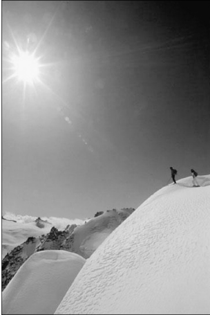
5. Khumbu, Népal, 1994.