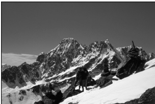
3. Rolwaling, Népal, 1986, photo de l'auteur.

Dans son expression la plus explicite, celle du risque de mort, le danger fascine. La valorisation des sportifs et des aventuriers contemporains, le succès des émissions et des magazines qui leur sont consacrés, le développement des activités de vertige et d'aventure qui prennent la pleine nature pour cadre, la mise en forme aventureuse de pratiques sportives banales (marche, vélo tout-terrain, course, nage) et la « sportivisation » des activités touristiques marquent la présence indéniable de la thématique des conduites et des prises de risque au cœur de notre société, précisément dans les activités physiques et sportives [Ewert et Hollenhorst, 1997 ; Le Breton, 2002 ; Lyng, 2005 ; Mitchell, 1983 ; Pociello, 1987 ; Vigarello et Mongin, 1987]. Les pratiques sportives apparaissent donc comme les objets d'étude par excellence des prises de risque.