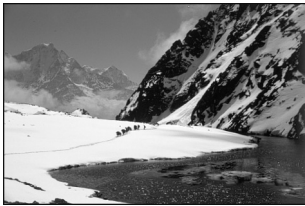
1. Khumbu, Népal, 1986.

8. Par exemple, envisager les sports et les conduites à risque comme une réponse à une crise anthropologique de nos sociétés contemporaines où le défaut de repères sociaux conduirait les individus à flirter avec leurs limites. Les prises de risque sportives constitueraient un rite de passage moderne permettant le maintien de l'équilibre de nos sociétés [Le Breton, 1991, 2002]. Ou bien, les thèses défendues par Patrick Baudry [1991] et Jean-Marie Brohm [1986], selon lesquelles la logique sportive de l'extrême assure la continuité d'une idéologie politique et d'un type de domination.