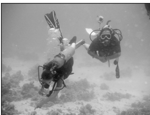
6. Plongée en mer Rouge, Égypte, 2004