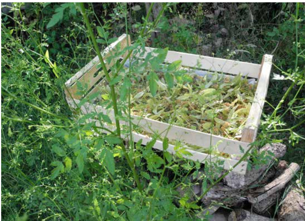
Cueillette de tilleul en Anjou, 2018.

nénuphar, fumeterre, bourse à pasteur, aubépine, sureau, tilleul, etc.