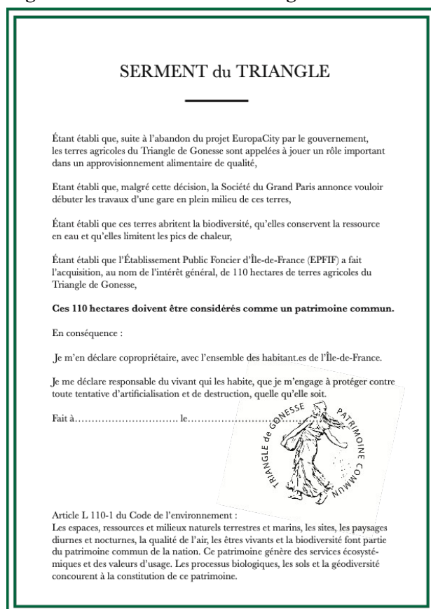
Figure 3. Le « serment du Triangle »

Devant ce refus de tirer les conséquences des décisions précédentes et cette fin de non-recevoir, les militants décident de prendre les choses en main. Le 17 janvier, pour l'anniversaire de l'abandon du projet d'aéroport de Notre-Dame-des-Landes (NDDL), lors d'une « zadimanche » sur un petit terrain qu'ils cultivent depuis 2017, ils lisent et appellent à la signature du « serment du Triangle » (figure 3). Plus de 500 personnes présentes, dont nombre de personnalités politiques, scientifiques et artistiques, signent une déclaration et un engagement qui fait de ces terres un patrimoine commun et d'eux des copropriétaires engagés à le défendre. Le clin d'œil au serment du Jeu de paume de 1789 est volontaire. Le parallèle entre les députés du tiers état, ignorés par Louis XVI, et les militants ignorés par le gouvernement se veut un symbole renversant la localisation du pouvoir.