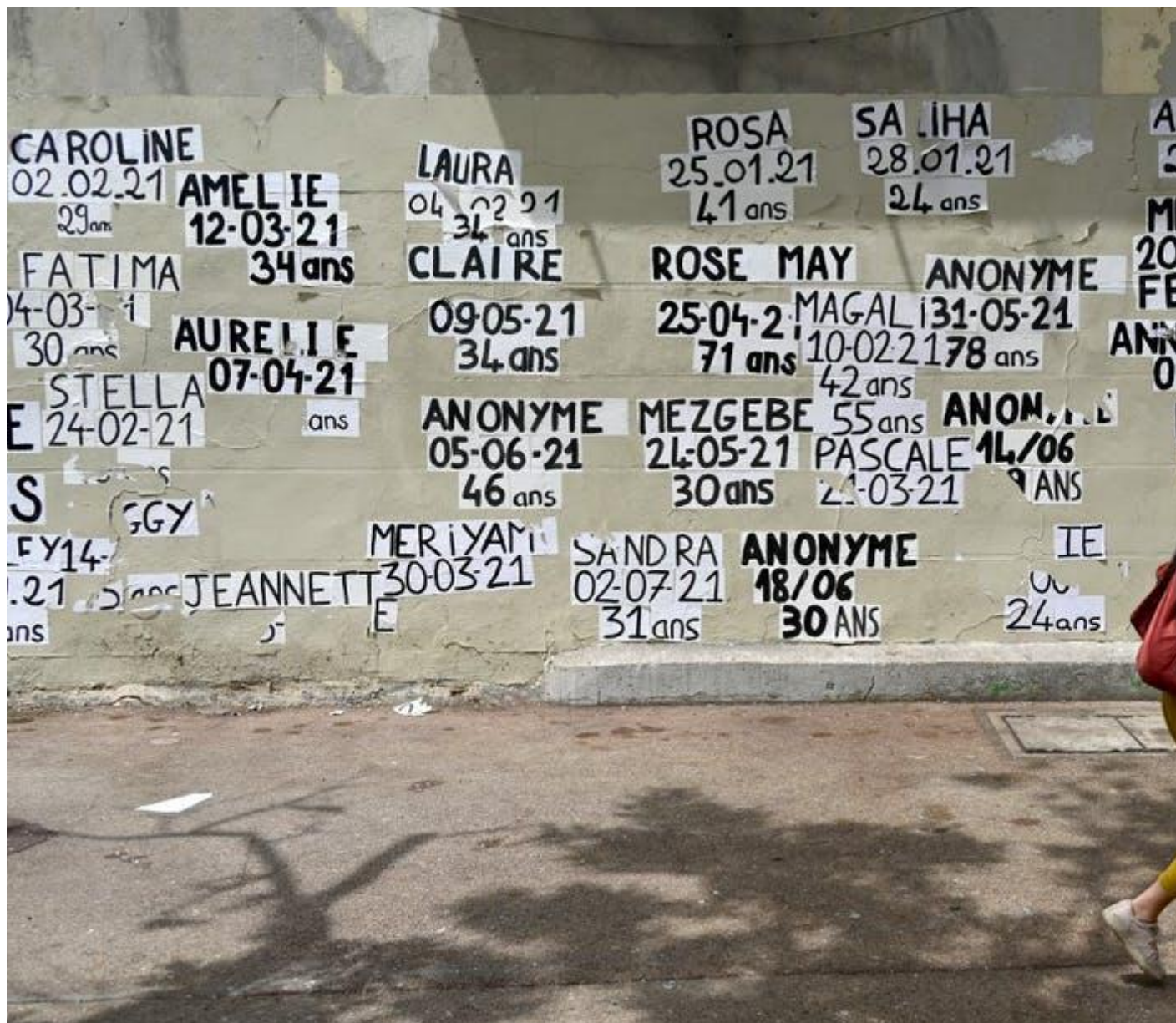
Collages d'un collectif féministe à Marseille, le 12 juillet, rappelant les noms de toutes les femmes tuées depuis le 1er janvier 2021.