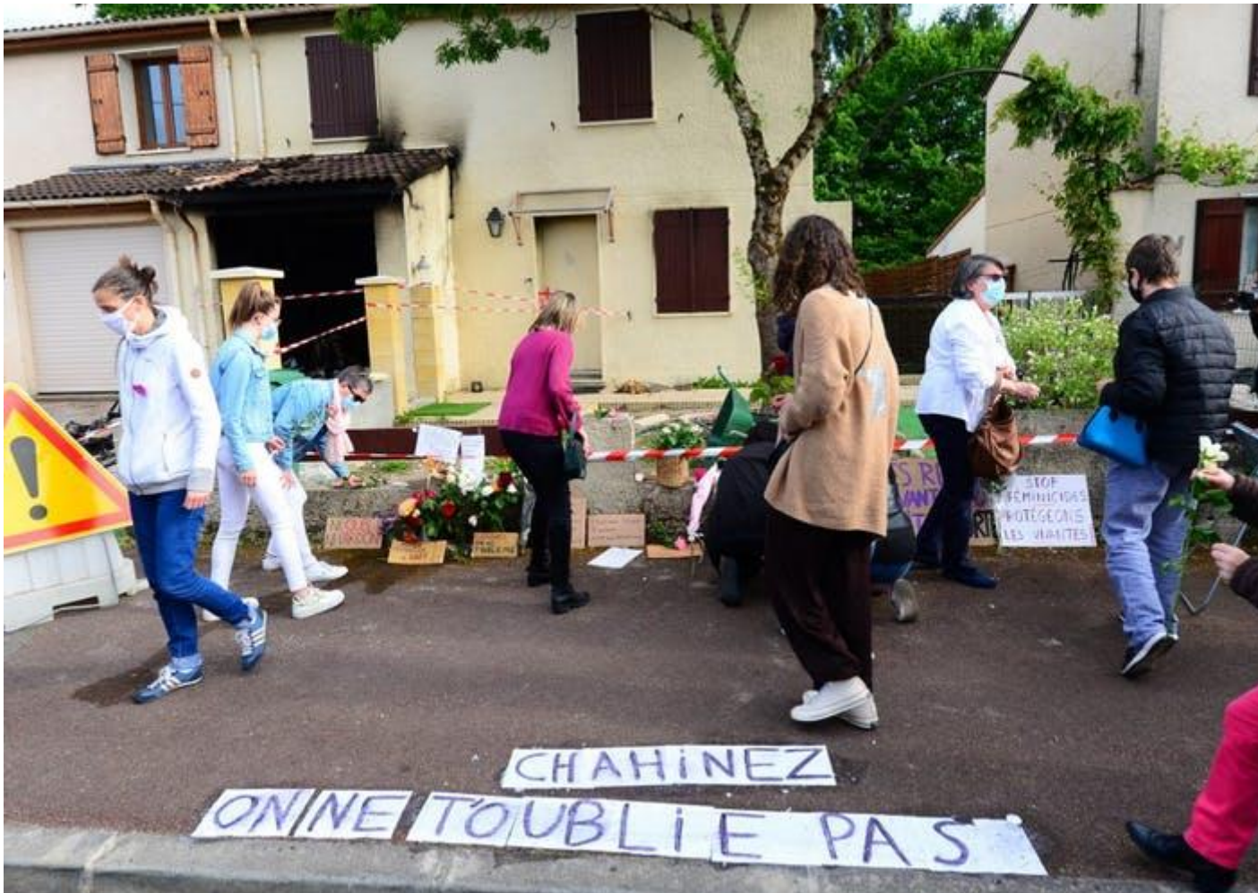
Mémorial pour Chahinez, une femme de 31 ans, battue et brûlée vive par son conjoint le 5 mai 2021 à Mérignac.

Le placement sous surveillance électronique (PSE) ou « bracelet électronique » est une mesure d'aménagement de peine permettant d'exécuter une peine d'emprisonnement sans être incarcéré. Il peut également être décidé dans le cadre d'une libération sous contrainte (LSC) ou dans le cadre d'une assignation à résidence, alternative à la détention provisoire, en attendant l'audience de jugement (ARSE) des auteurs de violences conjugales en état de récidive. Le bracelet électronique a pour le moment fait ses preuves en Espagne où le nombre de féminicides a significativement baissé . En France, depuis 2010, un juge aux affaires familiales peut délivrer une ordonnance de protection dans le but de mettre à l'abri une femme victime de violences conjugales.