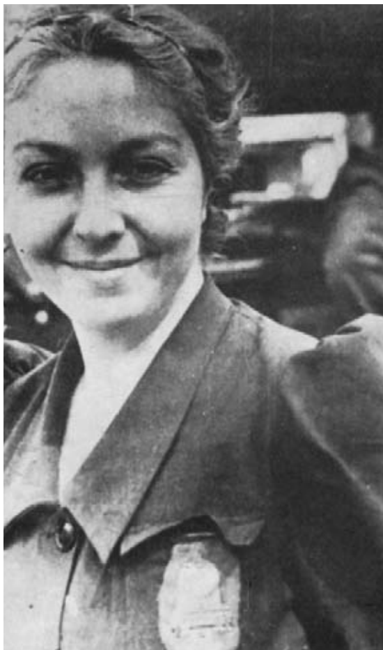
Les tréteaux de Madrid, María Teresa León, Paris, Les éditeurs français réunis, 1965.

Mais Alberti avait compris qu'il fallait convaincre les Soviétiques de ne pas faire dépendre la tenue du Congrès de la question de la présence de Gide. C'est pourquoi il attirait l'attention sur l'importance qu'aurait ce Congrès dans la condamnation internationale du trotskisme : « Le Congrès a une signification énorme. Il doit révéler l'attitude de vastes cercles d'intellectuels envers le fascisme. Il doit contribuer à la condamnation politique du trotskisme non pas tant en Espagne, où il est déjà condamné, que dans les pays d'Amérique Latine, où ils [les trotskistes - N.D.A.] déploient une activité frénétique. [...] Si André Gide venait au Congrès, nous pourrions, de manière diplomatique, ne pas mentionner son livre. Personne en Espagne ne permettra un seul mot contre l'URSS. Le mieux, naturellement, serait qu'André Gide s'arrête au Mexique où il se rend actuellement. » 22 Le résultat montre que le poète sut trouver les arguments pour parvenir à ses fins. Les mots présentant le Congrès comme un moyen de lutter contre le fascisme et le trotskisme furent soulignés au crayon rouge par le destinataire du document, Staline, ce qui prouve bien l'intérêt tout particulier qu'il porta à l'exploitation de l'événement en terme de propagande, aspect jugé pour-