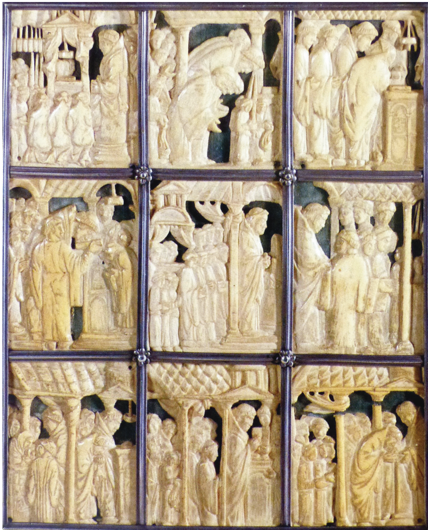
Ill. 87. Sacramentaire de Drogon, PARIS, Bibliothèque nationale de France , lat. 9428. Ivoires du plat inférieur de la reliure.