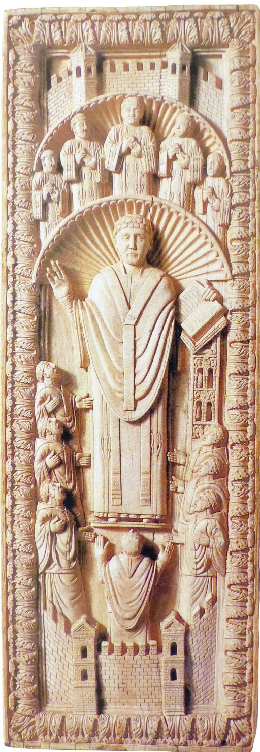
Ill. 88. Ivoire provenant probablement de la reliure d'un sacramentaire, CAMBRIDGE, Fitzwilliam Museum, inv. n° 12-1904.