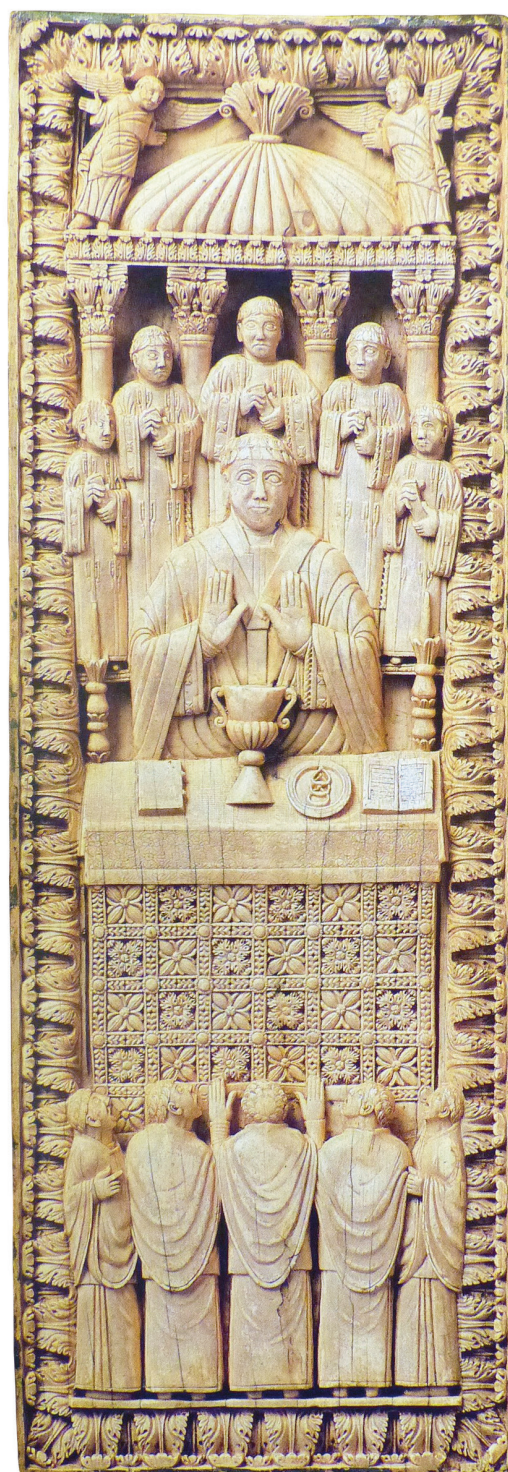
Ill. 89. Ivoire provenant probablement de la reliure d'un sacramentaire, FRANCFORT, Stadt-und Universitätsbibliothek, Ms. Barth. 181, Liebieghaus.