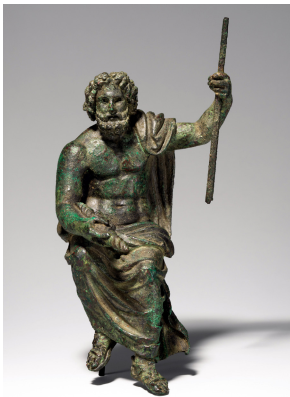
Fig. 4 : Jupiter capitolin, bronze. New York, The Metropolitan Museum of Art.

Il semble par conséquent s'imposer d'opérer là encore le rapprochement avec un type statuaire largement répandu dans le monde romain antique. Il s'agit de Jupiter capitolin, dont le bras gauche se lève pour tenir le sceptre, et dont le bras droit s'abaisse, doigts de la main refermés sur le foudre. C'était, à l'époque, une dérivation directe du fameux Zeus de Phidias 12 : la tenue du foudre, attribut majeur du dieu, étant alors substituée à la présentation de la statuette d'Athéna comme cela était le cas pour l'œuvre du sculpteur grec dans le temple d'Olympie ; mais cela sans modification de l'attitude générale et du vêtement. En raison du prestige du sanctuaire de Rome même, de multiples reproductions de ce type devaient être répandues dans l'Empire : en témoignent, notamment, les répliques miniaturisées en bronze recueillies sur divers sites 13 (fig. 4). Et il est bien probable