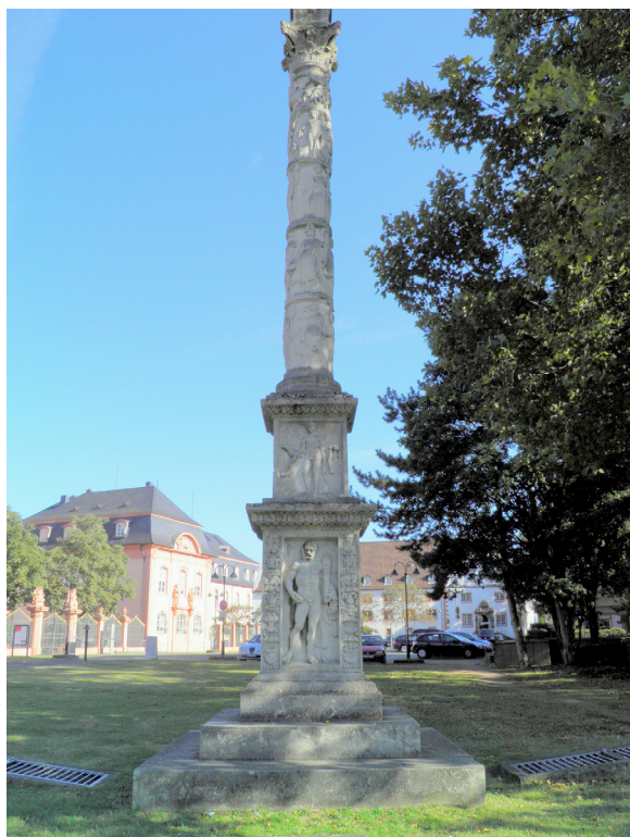
Fig. 1 : première colonne de Jupiter du Landesmuseum de Mayence (Inv. S. 137).

chement des pieds et quelques fragments. Enfin, on doit s'arrêter au « pilier des nautes » découvert au début du XVIII e siècle sous le chœur de Notre-Dame de Paris, et aujourd'hui conservé au musée national du Moyen Âge (thermes et hôtel de Cluny) 6 ; en raison de la dédicace gravée sur l'un des blocs inférieurs ( Iovi optimo maximo ), il est très probable qu'outre le Jupiter en bas-relief de l'une des faces d'un bloc supérieur, une statue en ronde-bosse de ce même dieu couronnait l'ensemble : c'est d'ailleurs ainsi que cela apparaît sur la restitution globalement convaincante qu'en a donnée Jean-Pierre Adam 7 (fig. 3).