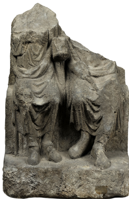
Fig. 7 : groupe de Jupiter et Junon provenant de la rue du Dôme (photo : Musées de la ville de Strasbourg, M. Bertola).