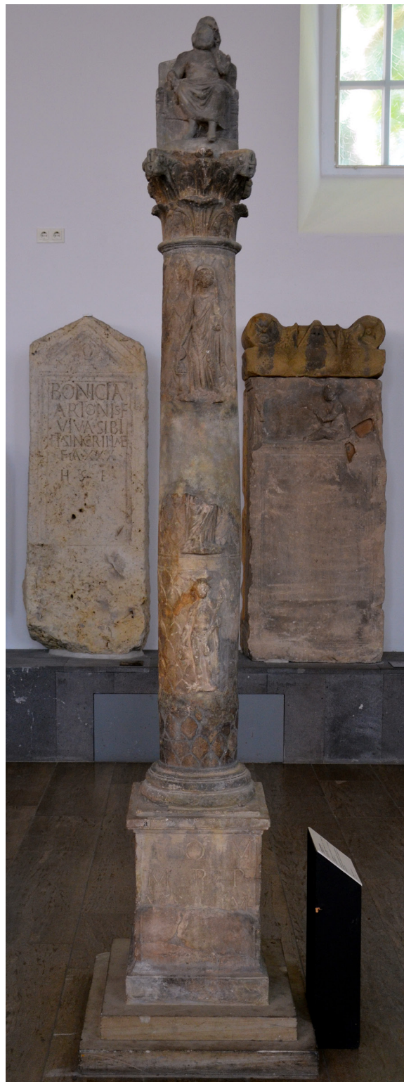
Fig. 2 : seconde colonne de Jupiter du Landesmuseum de Mayence (Inv. S 724).

évidemment invoquer le précédent du tympan roman de Sainte-Foy de Conques ; mais la position des bras y est exactement inverse, en parfaite concordance, là, avec la thématique générale : le Seigneur élève la dextre pour marquer l'accueil