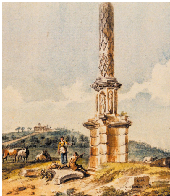
Fig. 5 : colonne de Cussy (actuel département de Côte-d'Or). Dessin de J.-B. Lallemand.