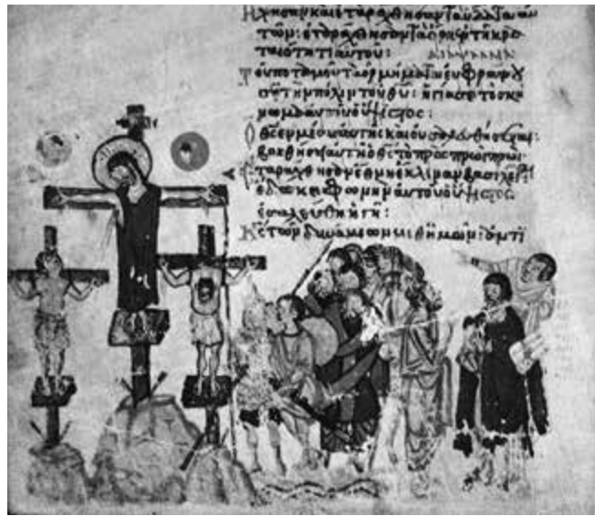
2. Mosca, Museo statale di storia, Salterio Khludov, fol. 45v, Crocifissione (da Zierys facsimiles)

bizantina, è in realtà attestata molto prima in quest'ultima: si verifica già – nonostante una forte stilizzazione – nel mosaico del narcece di Hosios Lukas, prima della metà dell'XI secolo; 12 e appare, con un trattamento molto più delicato e rivelatore della morfologia di Cristo, su un'icona del Sinai datata intorno a 1100 da Annemarie Weyl Carr. 13 Insieme all'attitudine dolente di Maria e di Giovanni, questo tratto, il quale ribadisce la corporalità – e dunque la natura umana – del Redentore potrebbe bene aver corrisposto alla voglia di suscitare l'emozione nella contemplazione dell'immagine, così come era espressa in un sermone di Michele Psellos verso la metà, appunto, dell'XI secolo. 14