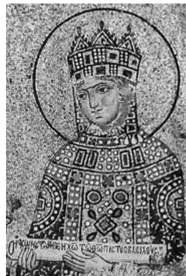
4. Constantinopoli, Santa Sofia, Donazione di Costantino Monomaco e Zoe , particolare

Ma mi pare che un altro aspetto degli affreschi della chiesa debba essere valutato; perché, invece del riferimento a una maniera attestata in un lungo arco di tempo per i panneggi, siamo di fronte a delle specificità più puntualmente assegnabili alla metà dell'XI secolo e ai decenni successivi. Il riferimento va al trattamento dei visi, con aspre opposizioni cromatiche indotte, soprattutto, dalla pupilla molto scura, dalla non meno forte ombreggiatura dell'arco sopraccigliare prolungato dal dorso del naso, nonché della palpebra inferiore e – in certi casi almeno – dei pomelli sulle guance; e si nota anche, in numerose figure, la configurazione della bocca, con il labbro inferiore ridotto sopra il mento