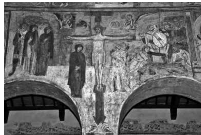
1. Abbazia di Sant'Angelo in Formis, Crocifissione (foto Jean-Pierre Caillet)

tanto orientale quanto occidentale, fino al XIII secolo per quest'ultima – era il risultato d'una ridipintura recente. 3 E anche riguardo l'introduzione della scena nel ciclo, è più che probabile ch'essa non risalga proprio al periodo paleocristiano, visto che si tendeva allora ad evitare la rappresentazione del Salvatore in tale situazione ignominiosa: William Tronzo ipotizzò che la modifica fosse intervenuta intorno al 680, sulla base dell'accenno ai 'taccuini' con le riproduzioni del ciclo vaticano che si legge in una Vita S. Pancratii dell'inizio del VIII secolo. 4 Ma Herbert Kessler ha aggiunto che poté anche accadere sotto Leone IV, il quale restaurò la basilica dopo l'assedio dei Saraceni nel 846; o alla fine del IX secolo sotto Formoso, cui qualche anno dopo il monaco Benedetto di Soratte attribuiva un altro restauro degli affreschi. 5 In ogni modo – e si tratta allora dell'elemento che ai fini del presente contributo veramente importa – si può ritenere che, al tempo di Desiderio, nella basilica vaticana si offriva un programma iconografico suscettibile di vedersi ripreso, forse nella nuova abbazia stessa di Montecassino (ciò che purtroppo non siamo più in grado di verificare), poi nel priorato di Sant'Angelo.