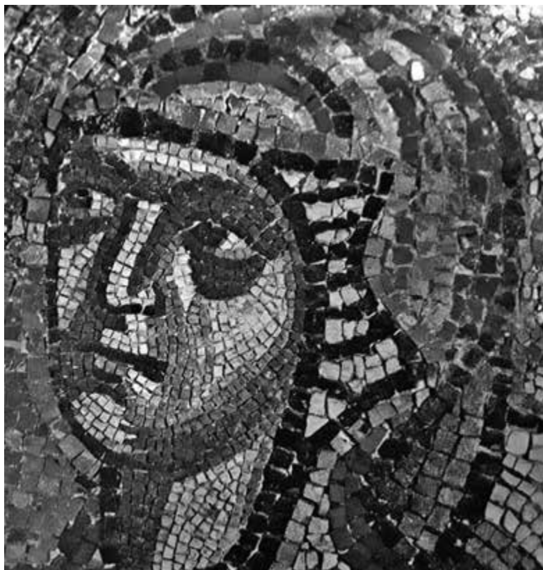
5. Chio, Nea Moni, Discesa al limbo, particolare