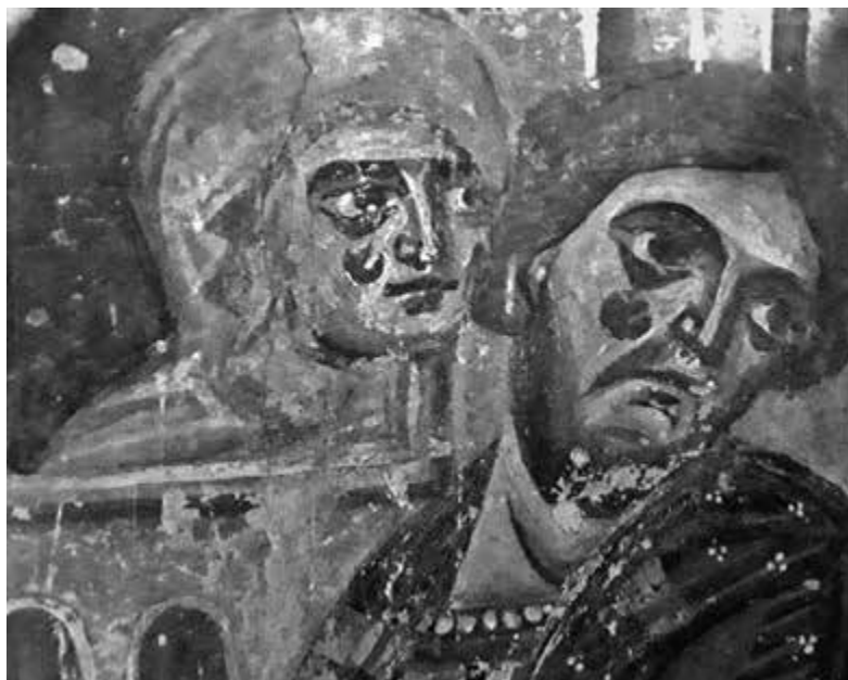
3. Abbazia di Sant'Angelo in Formis, Lavanda delle mani di Pilato , particolare

Mi sembra ora opportuno tornare sulla questione più importante, vale a dire il fatto che – dopo Fernanda de' Maffei e Beat Brenk – 21 Glenn Gunhouse ipotizzò che nel Codex Benedictus custodito alla Vaticana (Vat. lat. 1202), secondo lui prodotto a Montecassino per la dedizione della chiesa omonima nel 1071, si ritroverebbero, quasi tre quarti di secolo dopo, parecchie caratteristiche del famoso Menologio di Basilio II anch'esso alla Vaticana (Vat. gr. 1613): 22 cioè, essenzialmente, lo stesso trattamento dei panneggi simili al cloisonné , i doppi contorni e le lumeggiature a denti di pettine. Innanzi tutto si può precisare che la datazione esatta del Codex Benedictus non è così accertata. Giulia Orofino è propensa a posporla di qualche anno, riconoscendovi giustamente una sensibilità alla corrente comnena illustrata di “figurette leggere ed eteree”, e di cui la penetrazione in ambiente cassinese fu facilitata dai doni degli imperatori (Michele VII nel 1076, poi Alessio I nel 1089). 23 Questo carattere sottile non spicca veramente, a mio avviso, nelle figure di Sant'Angelo.