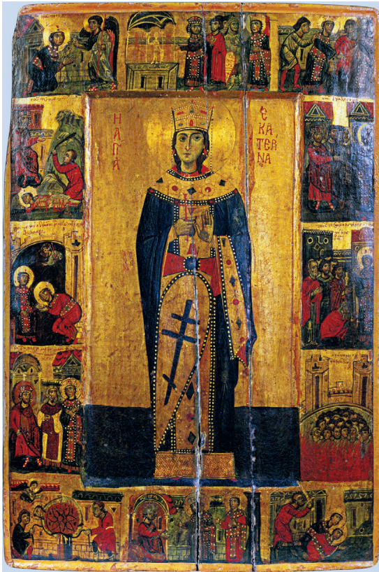
Fig. 4. Icône avec sainte Catherine. Mont Sinai, couvent Sainte-Catherine.

vée aux Uffizi à Florence 23 (fig. 6) ; et celui consacré à saint Dominique dû à Francesco Traini, en date de 1345, aujourd'hui au Museo San Matteo de Pise 24 (fig. 7). Dans ces trois derniers cas, et étant donné que l'usage des retables était désormais, sinon toujours de règle, du moins assez répandu 25 , il est fort probable qu'il s'agissait de tableaux installées de façon permanente sur un autel : ce qui – bien que sans association directe au cercueil du saint – correspondait à une situation du même ordre que pour le tableau de Bembo dans l'oratoire San Sebastiano.