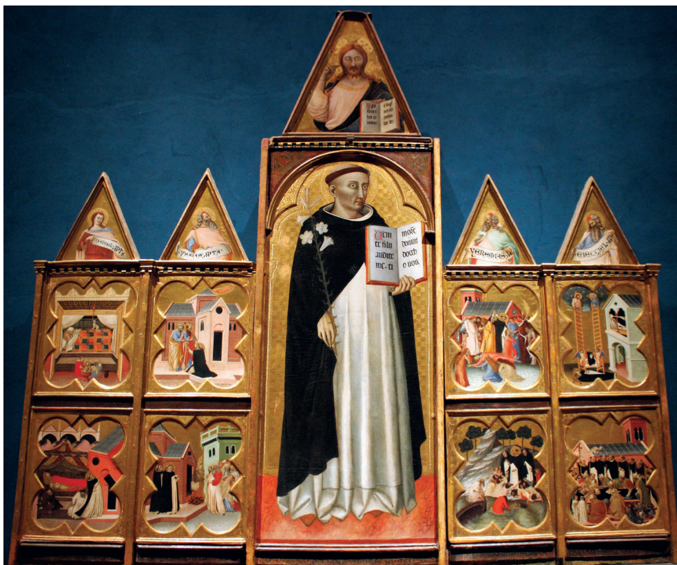
Fig. 7. Francesco Traini, pala avec saint Dominique. Pise, Museo San Matteo.

dans un couvent de Faenza – et donc sur le versant adriatique du Nord-Est de la Péninsule 27 ; d'autres spécimens auraient donc pu être destinés à des églises de cette zone dès les décennies précédentes. Et dans le sillage stylistique de Giotto, le foyer riminois a d'ailleurs manifestement produit des œuvres de semblable nature : ainsi par exemple le vérifie-t-on avec les éléments, aujourd'hui dispersés entre plusieurs collections européennes et nord-américaines, provenant d'un retable démembré de longue date et dû au Maître de la Vie de Jean-Baptiste, actif dans la première moitié du XIV e siècle 28 ; le compartiment central y montre certes une Vierge à l'Enfant et non le saint lui-même, mais le principe d'une association avec des scènes narratives de chaque côté s'y voit bien maintenu.