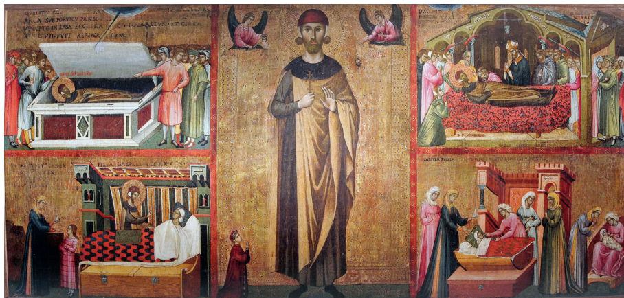
Fig. 1. Paolo Veneziano (attribué à), Tavola Bembo . Vodnjan (Istrie), église Sveti Blaž.

Le plus ancien des deux tableaux consacrés au bienheureux Leone Bembo (fig. 1) que conserve depuis 1818 l'église Sveti Blaž (San Biagio) de Vodnjan (Dignano d'Istria) a été mentionné à de nombreuses reprises dans le cours d'une historiographie remontant déjà à près d'un siècle 1 . C'est alors très largement le problème de son auteur qui se trouve abordé : le nom de Paolo Veneziano y revient le plus souvent, mais certaines propositions orientent plutôt vers un devancier de son style, ou envisagent l'intervention de l'un de ses collaborateurs ou « suiveurs ». Je ne m'engagerai pas ici dans cette question, me contentant simplement de souligner que l'incontestable qualité de l'œuvre et ses traits formels ne manquent pas d'inciter à l'attribution en propre au grand maître vénitien ; et il s'agirait ainsi d'une de ses premières réalisations, comme l'a suggéré notamment Francesca Flores d'Arcais 2 . D'autre part, quelques récentes études se sont attachées à d'autres aspects non moins essentiels. Il