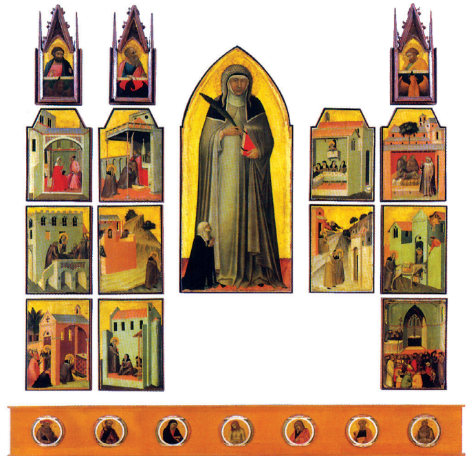
Fig. 6. Pietro Lorenzetti, pala avec la bienheureuse Umiltà (reconstitution de la disposition d'origine). Florence, Uffizi.