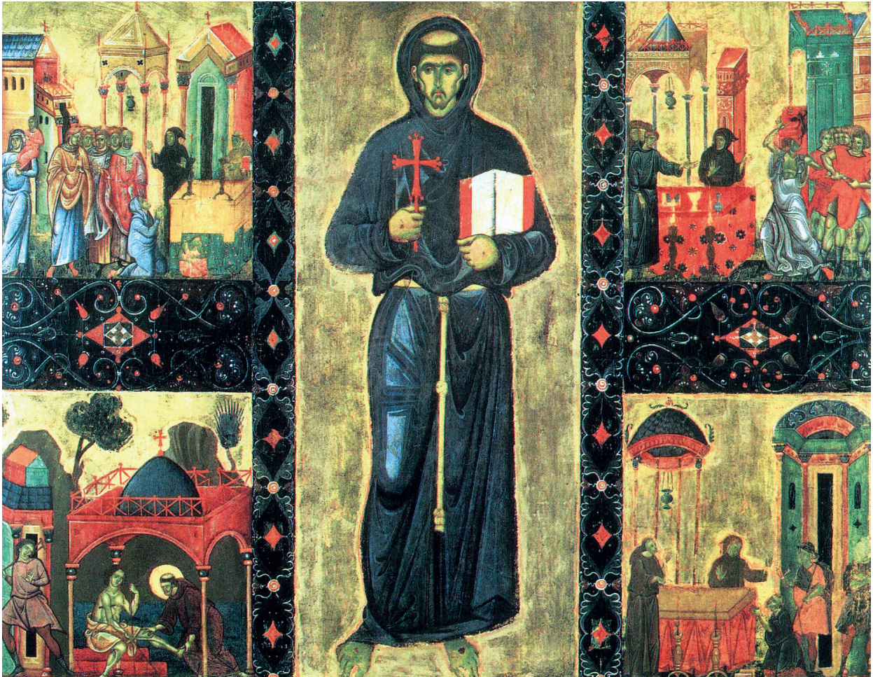
Fig. 3. Giunta Pisano (attribué à), dossal avec saint François. Pinacothèque Vaticane.

qui dérive manifestement du modèle des icônes « biographiques », exaltant également un saint, produites dans le monde byzantin à partir de la fin du XII e siècle 21 (fig. 4). Par rapport à ces dernières, on note cependant que sur les tableaux toscans en question, les scènes narratives se disposent uniquement de part et d'autre de la figure en pied, et non tout autour de celle-ci ; ce qui évidemment convenait mieux au positionnement – ne fût-il qu'occasionnel, comme on vient de le rappeler – sur la table d'autel.