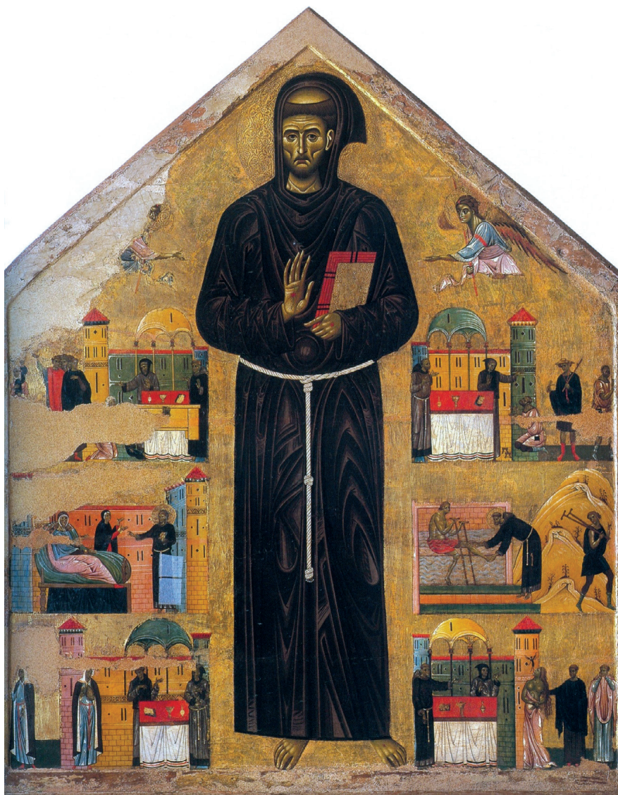
Fig. 2. Giunta Pisano (attribué à), dossal avec saint François. Pise, Museo San Matteo.

– vraisemblablement des tableaux mobiles exposés sur l’autel le jour de la fête du saint, comme l’a souligné Hans Belting 18 – consacrés à François d’Assise. L’un, daté de 1235, est dû au lucquois Bonaventura Berlinghieri et se trouve dans l’église San Francesco de Pescia 19 . Trois autres, parmi les principaux produits dans les décennies suivantes, sont attribués à Giunta Pisano (ou à son cercle, du moins, pour un ou deux d’entre eux) et respectivement conservés au Museo San Matteo de Pise (fig. 2), à la Pinacothèque Vaticane (fig. 3) et dans le Trésor de la Basilique San Francesco d’Assise 20 . Tous montrent au centre l’image du saint en pied et, de chaque côté, plusieurs scènes de sa vie ; ce