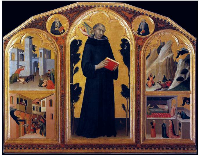
Fig. 5. Simone Martini, pala avec le bienheureux Agostino Novello. Sienna, Pinacoteca nazionale.

Il est vrai qu'a priori, on manque d'indices directs susceptibles d'expliquer la transposition de tels modèles toscans dans le milieu vénitien : Giotto, certes venu à Padoue et à Rimini au début du siècle 26 , ne semble pas en avoir peint lui-même. Mais d'autre part, il ne faut pas négliger le fait que la pala de la bienheureuse Umiltà (fig. 6) mentionnée ci-dessus se trouvait originellement