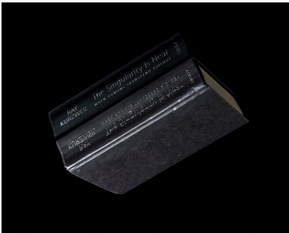
Figure 1 : Ray