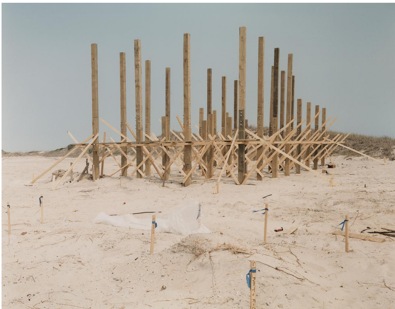
Figure 3 : Public Beach Structure .

de l'avenir, ainsi que la possibilité effective d'accéder à ce qu'il promet : son utopie s'ouvre à tous, mais concerne actuellement les intérêts d'un groupe assez restreint. En particulier, cette distorsion concerne l'écart entre ses ambitions théoriques et ses manifestations concrètes : ses promesses utopiques d'amélioration et de liberté nourrissent l'imaginaire collectif, mais sont construites sur le terrain et les mécanismes de ce même système qui contribue depuis longtemps à accroître les inégalités économiques et sociales. À ce propos, on peut évoquer rapidement la définition de l'idéologie développée par Karl Mannheim, auquel Ricœur fait référence (Ricœur 1984 : 61). Le sociologue allemand voyait tant dans l'utopie que dans l'idéologie un ensemble d'idées qui transcendent la réalité, mais reconduisait l'idéologie à ces « idées situationnellement transcendantes (qui dépassent la situation) qui ne réussissent jamais de facto à réaliser leur contenu » (Mannheim, 1929 : 65). Cette définition de l'idéologie nous paraît être pertinente pour lire le phénomène transhumaniste : son projet de dépassement du réel et des limites de l'humain peut contribuer au maintien du statu quo . Son utopisme, par conséquent, semble être redimensionné et vidé de son sens libérateur plus radical.