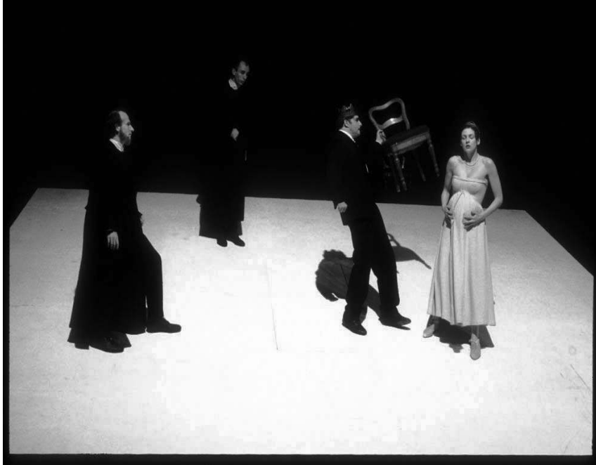
Fig 6 : Acte 2, scène 1, Léontès accuse Hermione.

entre ce côté réflexif, extrêmement sophistiqué, et cette simplicité dans la manière de raconter l'histoire ? Était-ce complexe d'agencer ces deux extrêmes ?