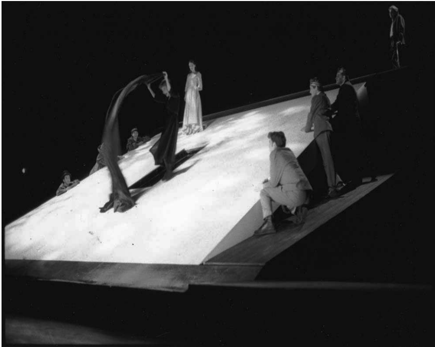
Fig 1 : Acte 5, scène 3, Paulina dévoile la statue.

Jean-Michel Déprats : Une constante de votre travail scénique, Stéphane Braunschweig, est que chaque scénographie est une dramaturgie. La pensée sur la pièce s'exprime à travers un dispositif scénique qui n'est pas simple machine à jouer mais aussi machine à penser. Ainsi, la symbolique du plan incliné traduit une fracture. Que dit ce plan incliné sur la pièce ?