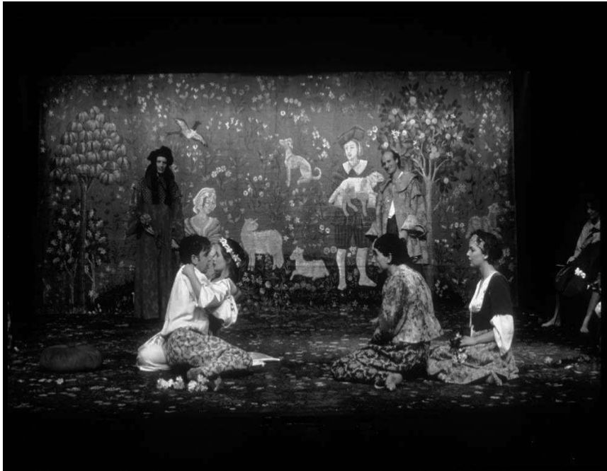
Fig 2 : Acte 4, scène 4, la Pastorale.

JMD : L'autre moment que l'on pourrait évoquer, c'est la pastorale où il y a cette toile peinte d'inspiration Renaissance qui interdit tout naturalisme. Dans la mise en scène d'Adrian Noble (RSC, 1993), le traitement de la pastorale était tout autre. On y voyait une sorte de fête de la bière bavaroise très naturaliste. Ici, la pastorale est mise à distance comme genre.