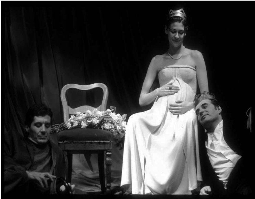
Fig 5 : Acte 1, scène 2.

deux hommes assis aux pieds d'Hermione enceinte, comme s'il s'agissait de deux enfants. À côté d'Hermione, une chaise recouverte de fleurs restait vide. Qui devait trôner à ses côtés ? Nous savons par ailleurs que Polixénès est en Sicile depuis neuf mois. Il peut donc être, potentiellement, le père de l'enfant à naître... ce que personnellement je réfute. Polixénès est innocent... mais pas du désir de l'enfant ni du désir d'Hermione. Il décide de rentrer d'urgence parce qu'il ne peut pas supporter l'idée de cette naissance.