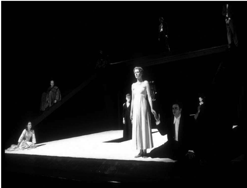
Fig 3 : Acte 5, scène 3, la scène de la statue.

où il lui est impossible de parler chaleureusement à Perdita. J'avais donc disposé le petit costume de Mamillius, copié des modèles de la Renaissance, une couleur très marquante, le vert 3 , la seule au début du spectacle si l'on omet le rideau rouge, pour dire que l'enfant était perdu à jamais. Cela dénotait également la position extérieure du personnage qui observe les autres dès le premier acte. Tout ce passe sous le regard de Mamillius. On peut d'ailleurs penser que Mamillius meurt de ce qu'il a vu... Ce n'était pas pour finir sur une note tragique, mais plutôt sur celle de l'expérience de la perte. Cette expérience, c'est aussi la vie lorsqu'elle n'est pas séparée de la mort. Cela disait aussi que la troisième partie de la pièce, c'est-à-dire le retour en Sicile, n'est ni tragique ni comique : il accompagne le spectateur vers un retour au réel, qui paradoxalement se fait par un événement théâtral et magique.