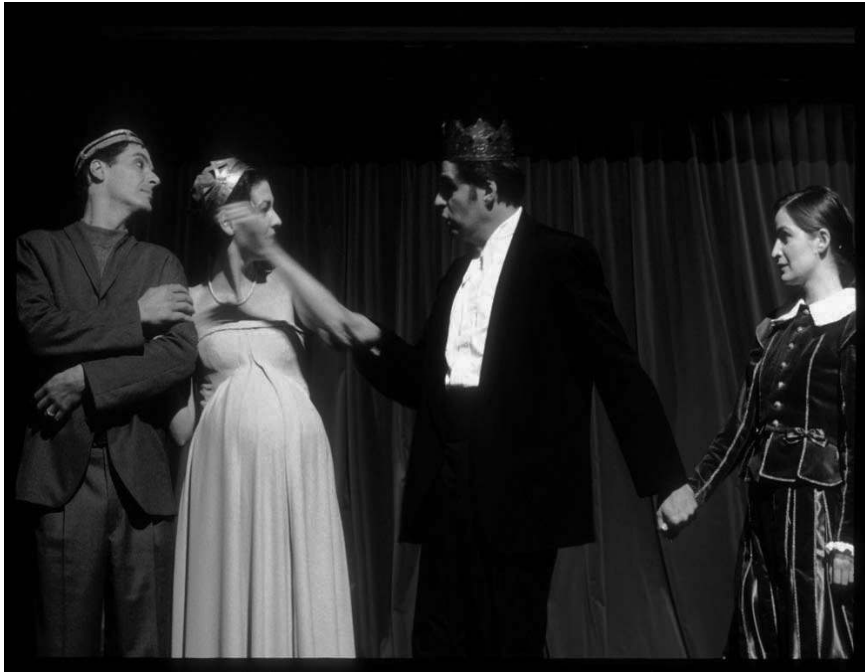
Fig 4 : Acte 1, scène 2, Polixène, Hermione, Léontès et Mamillius.