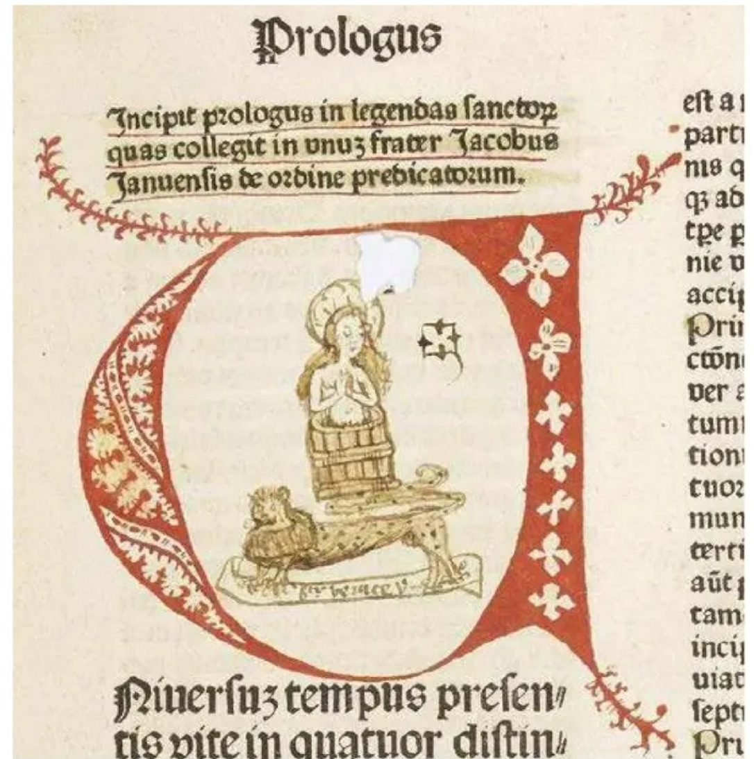
Fig. 12. Sainte Venisse (Véronique). Jacques de Voragine, Legenda aurea . Nuremberg : Anton Koberger, 11 VIII 1478. – Valognes, BM, impr. R-11, f. 1.