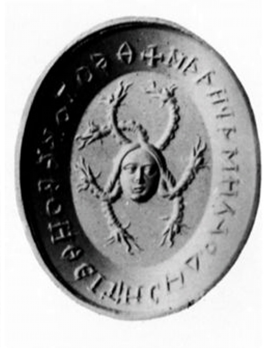
Figure 1: Pirro Ligorio, gem drawing and cast