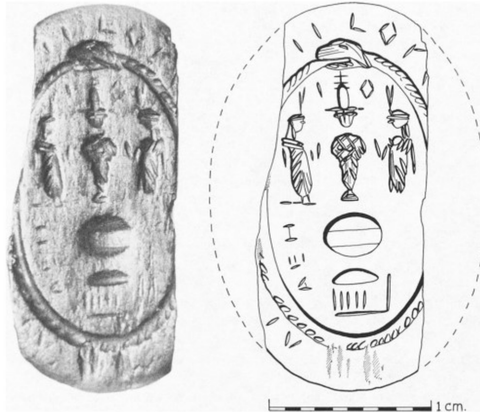
FIG. 1.—Uterine amulet A.6832; photograph courtesy of the Oriental Institute, University of Chicago; drawing by W. Raymond Johnson