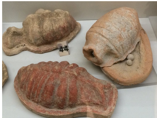
Italie centrale IV e -II e s. av. JC → I er -III e s. ap. JC →