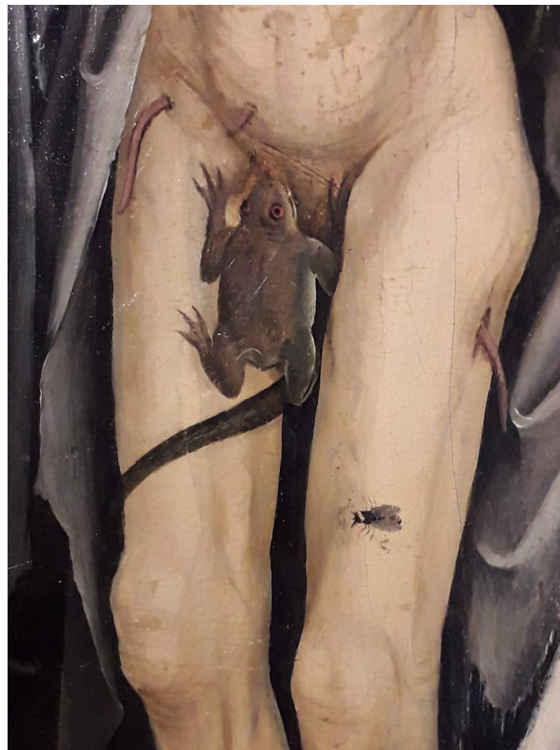
Les amants trépassés , anonyme, fin XV e s. (Musée de la Fondation de l'Œuvre Notre-Dame, Strasbourg)