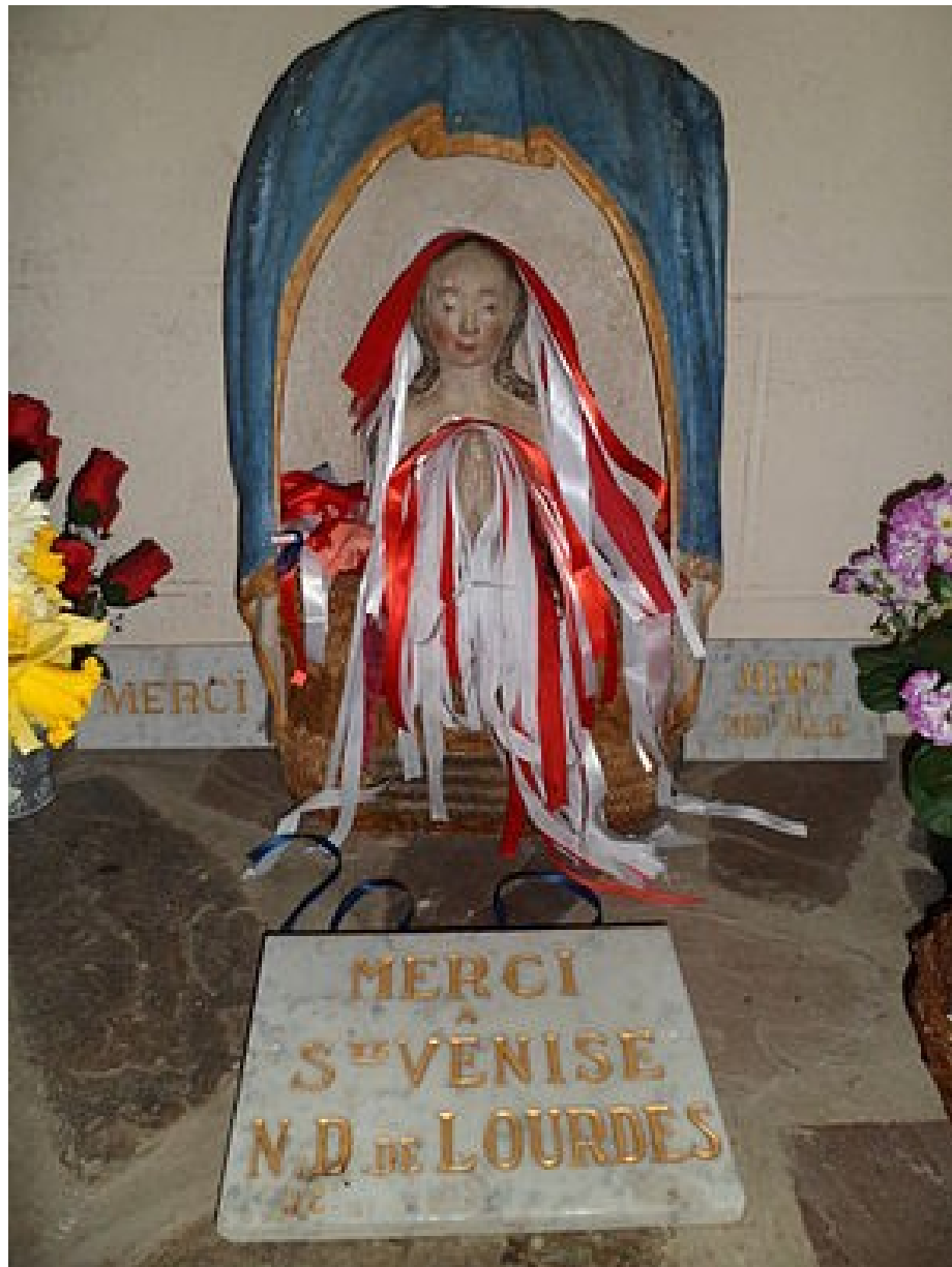
Église ND, La Bloutière (Normandie)