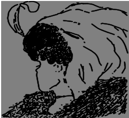
Figure 1: Vieille femme ou jeune fille?