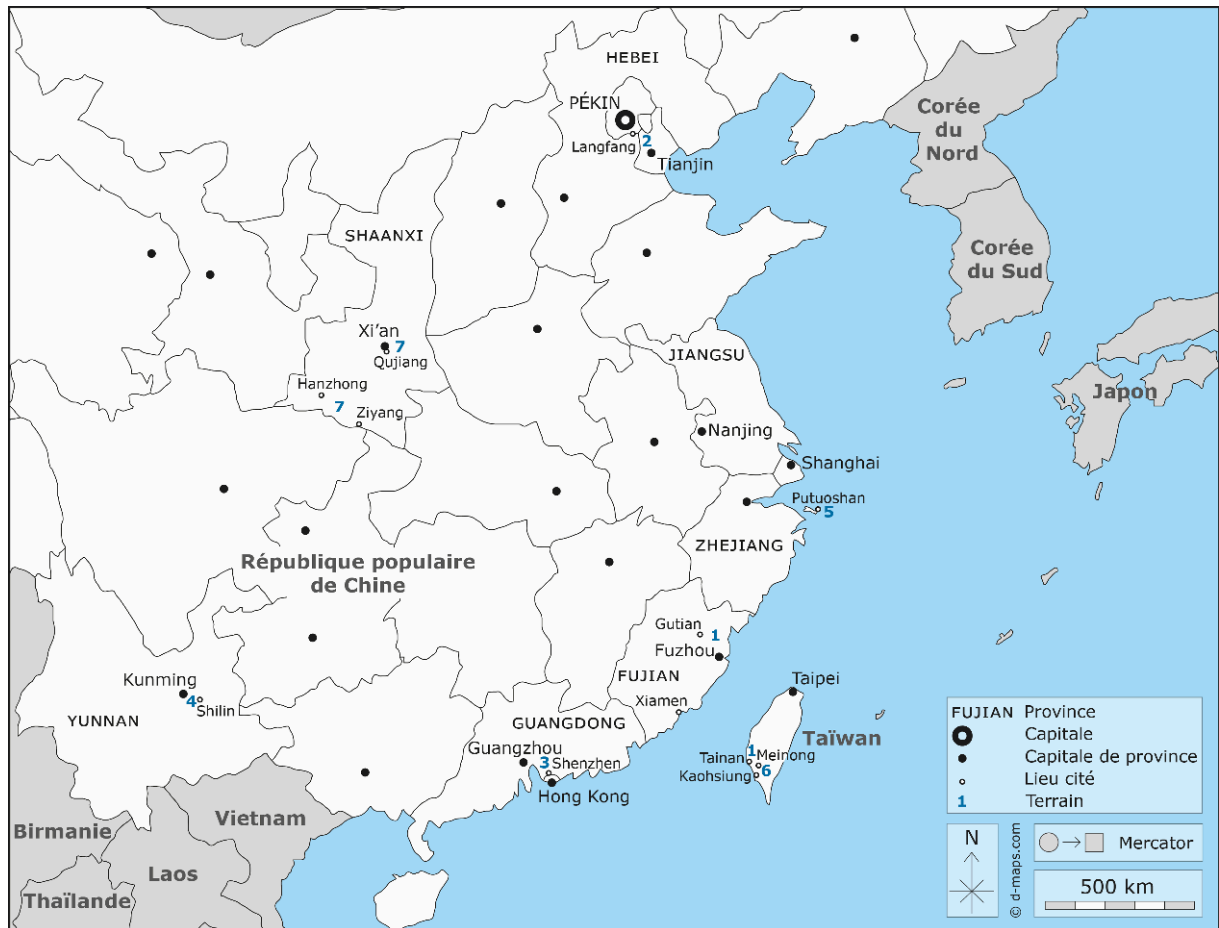
FIG. 3 – Carte des terrains mentionnés dans les contributions du présent numéro

Légende : 1. Brigitte Baptandier ; 2. Gladys Chicharro ; 3. Anne-Christine Trémon ; 4. Aurélie Névoit ; 5. Claire Vidal ; 6. Ko Pei-yi ; 7. Adeline Herrou