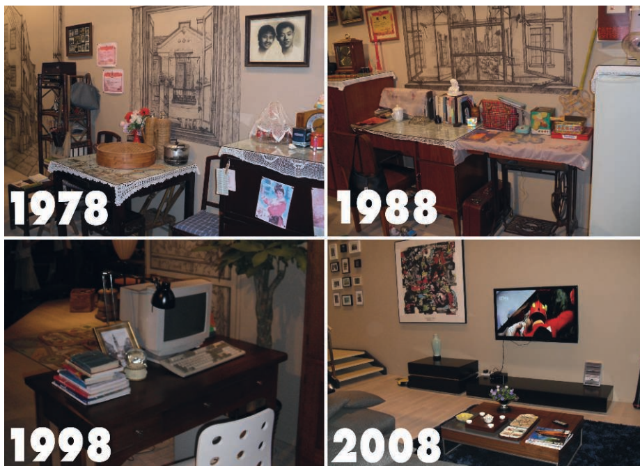
FIG. 2 – Trois décennies de salons chinois. La salle d'exposition « Réminiscence » dans le pavillon chinois