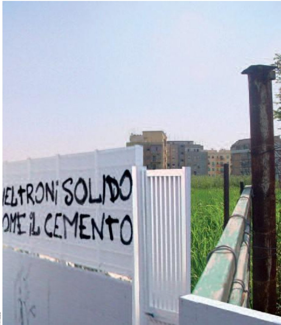
Revendication en périphérie romaine, quartier de Pietralata.

Il existe donc une forme de "coût spatial" du mécanisme : la poursuite de l'étalement urbain toujours plus loin dans la périphérie. Par un étonnant paradoxe, les écologistes romains en viennent aujourd'hui à réclamer moins d'espaces verts pour limiter la "progression du ciment" dans la campagne romaine ! Quant à la "compensation infrastructurelle", largement utilisée sous d'autres formes ailleurs en Europe, elle inclut rarement la participation aux équipements de transport public (les plus coûteux) et implique une renégociation permanente des pro-