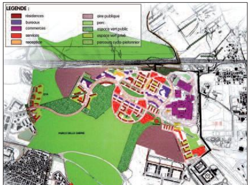
Plan de la centralité métropolitaine de Bufalotta.

En confirmant la forme prescriptive du Plan régulateur, la loi de 1942 établit que les droits à bâtir acquis par le secteur privé dans le cadre d'un PRG sont toujours en vigueur dans les Plans successifs.