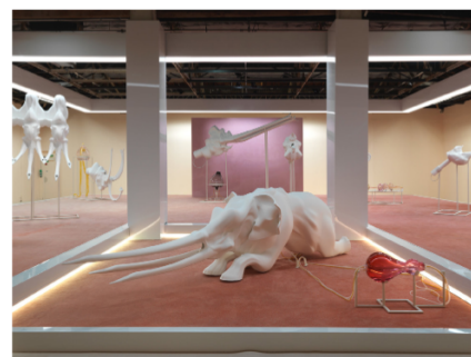
Fig. 3 Marguerite Humeau, Foxp2 , 2016. Exhibition view, Nottingham Contemporary. Courtesy the artist, galerie Clearing, Brussels, galerie Duve, Berlin. Photo by Stuart Whippes.

Il s'agit donc d'envisager, d'imaginer et de percevoir le monde de manière totalement différente et neuve, du point de vue des animaux et non plus des humains. Cette nouvelle dimension de perception résonne avec la théorie du "perspectivisme et multinaturalisme" de l'anthropologue brésilien Eudardo Viveiros de Castro 3 qui dressent les différences entre humains et non-humains: