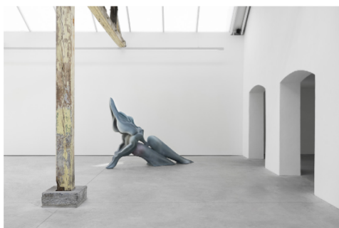
Fig. 4 Marguerite Humeau, The Prayer , from Mist , 2019. Galerie Clearing, Bruxelles.

de baleines échouées sur une plage de Nouvelle-Zélande en 2014 comme si le phénomène d'extinction de masse rendait les animaux conscients de leur propre vulnérabilité et finalité. Entraînant ainsi une diminution des frontières entre humains et animaux.