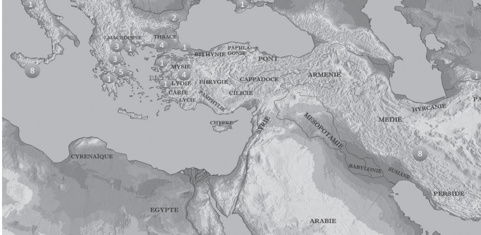
Figure 3 : Répartition géographique des mentions de cavalerie chez Polyen.

du stratège athénien Charès opérant contre les Thraces au IV e siècle, ou de Philopœmen, réformateur de la cavalerie achéenne à la fin du III e siècle 73 .