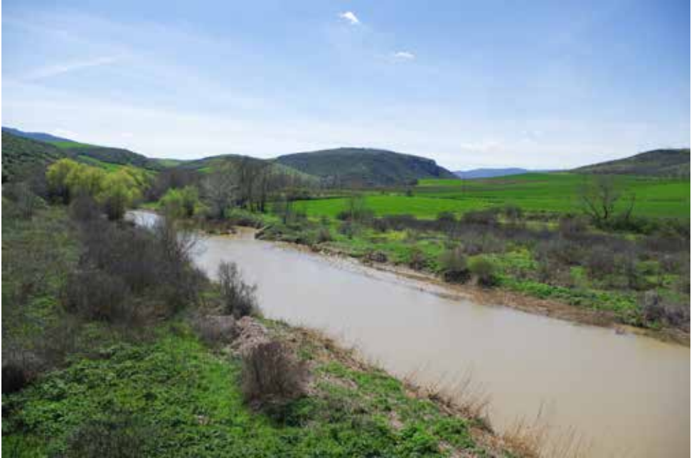
Fig. 2. L'Énipeus au printemps dans les confins orientaux du territoire de Pharsale, avril 2015.

un graben formé de deux plaines séparées par une série de collines basses et traversées par des cours d'eau pérennes comme le Pénée et ses affluents. La région dispose donc de grandes surfaces agricoles bien arrosées et fertiles, ce qui fait de la Thessalie un monde à part au milieu d'une Grèce méditerranéenne plus aride et montagneuse. La cité d'origine de Bucéphale, Pharsale, se situe dans le sud de la plaine occidentale (fig. 1).