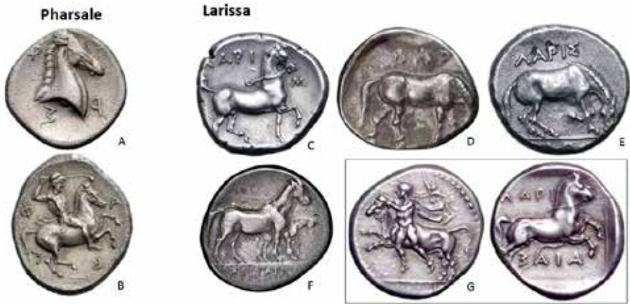
Fig. 3. Exemples de types monétaires frappés à Pharsale et Larissa au milieu du IV e siècle av. J.-C.

éleveur en cas de vagabondage, mais aussi et surtout pour permettre à la cité de prélever des taxes sur les troupeaux 23 .