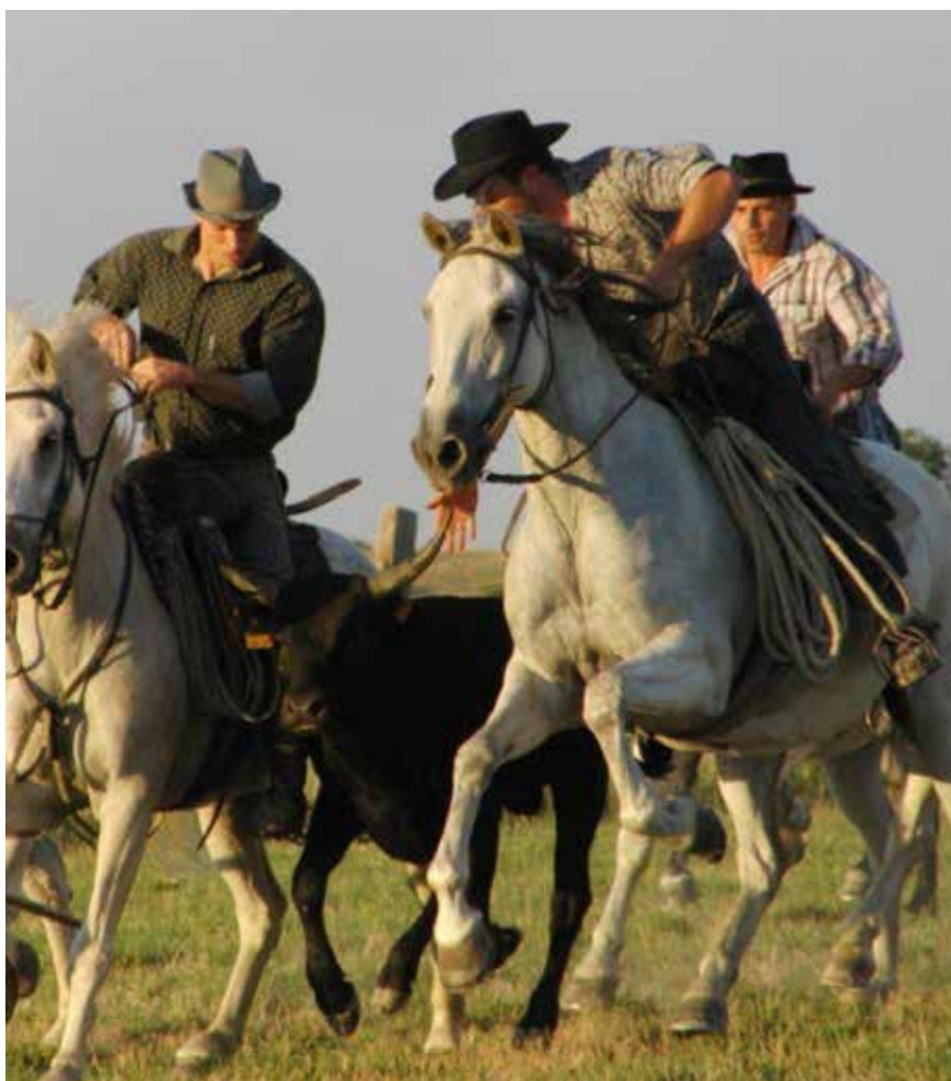
Fig. 4. Capture de l'anouble, taurillon d'un an, pour le marquage, en Camargue, 2020.

Bucéphale est lui-même considéré comme un grand cheval de son temps 30 , et cette particularité a pu être remarquée par les gardiens de troupeaux dès que Bucéphale a atteint ses trois mois, car les jambes des poulains sont disproportionnées par rapport au reste de leur corps et permettent d'estimer la future taille adulte 31 . Les gardiens surveillent bien le poulinage, mais de loin et discrètement, car ils ont pour consigne de ne pas toucher le nouveau-né 32 . Ils