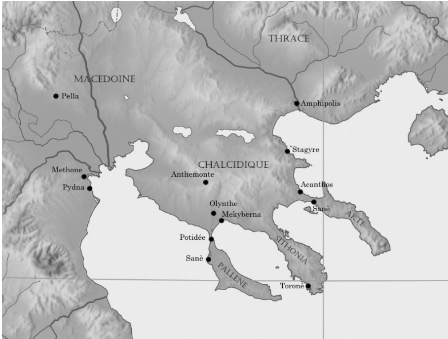
Figure 1. Carte de la Chalcidique.

scellent une alliance avec Athènes, fournissant ainsi à Philippe un casus belli 25 . En cette année 349/348, Lasthénès commande toujours la cavalerie fédérale puisque c'est dans cette fonction qu'il aurait accompli son forfait, et il compte Euthycratès pour collègue 26 .