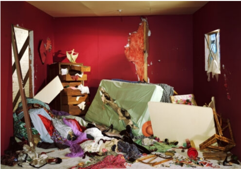
Jeff Wall, The Destroyed Room, 1978