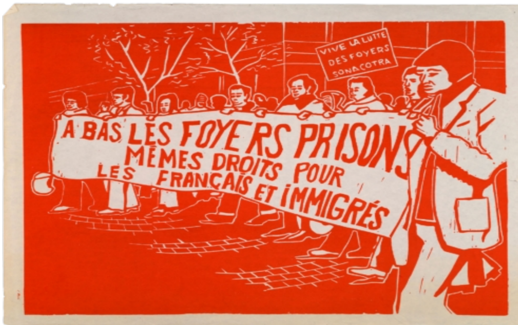
Atelier sérigraphique du Centre universitaire expérimental de Vincennes, À bas les foyers-prisons , 1976

La chambre occupée , c'est celle d'un foyer Sonacotra qu'habite le travailleur nord-africain, le chibani , avec ses blessures et ses cicatrices. Foyers/prisons, résidences surveillées pour ceux dont l'État se méfie et qu'il déplace au gré de ses envies. Et, parfois, dernier endroit dans lequel ces « habitants de nulle part 2 » terminent leurs vies. Les sujets des images de Wiam Haddad sont les corps immigrés vieillissants loin des territoires les ayant vus naître.