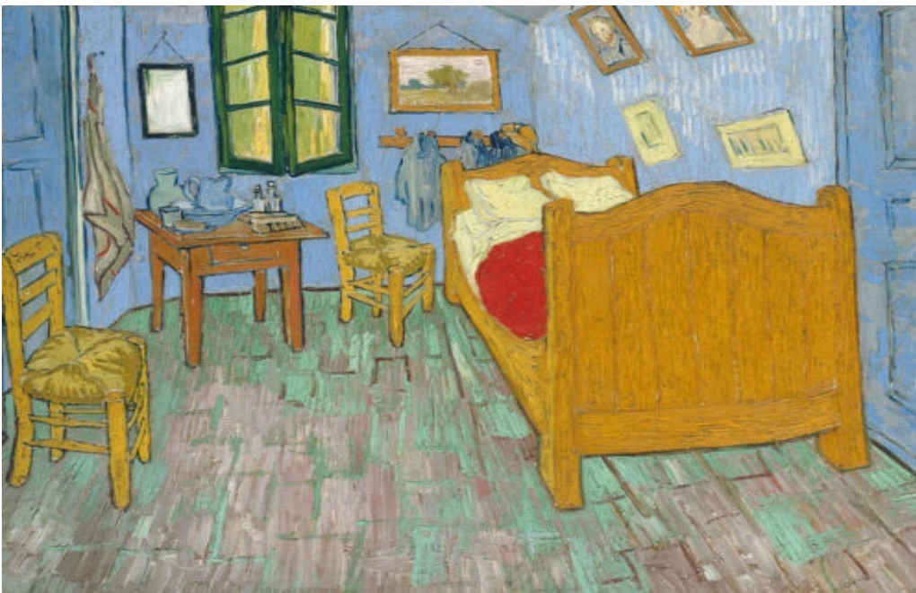
Vincent Van Gogh, La chambre à Arles , 1889, courtoisie Art Institute of Chicago

La chambre occupée , c'est celle d'un foyer Sonacotra qu'habite le travailleur nord-africain, le chibani , avec ses blessures et ses cicatrices. Foyers/prisons, résidences surveillées pour ceux dont l'État se méfie et qu'il déplace au gré de ses envies. Et, parfois, dernier endroit dans lequel ces « habitants de nulle part 2 » terminent leurs vies. Les sujets des images de Wiam Haddad sont les corps immigrés vieillissants loin des territoires les ayant vus naître.