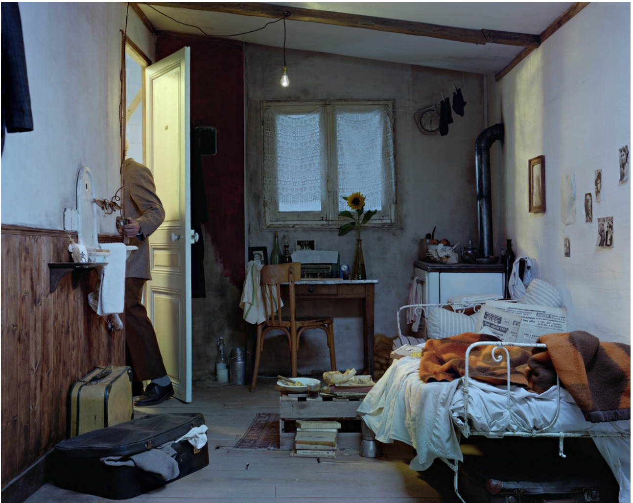
Wiame Haddad, À propos d'une chambre occupée (vision d'une soirée d'octobre 1961), 2020

Marchant d'un pas pressé dans la demi-nuit des après-midi de décembre, j'ai bien failli passer à côté de cette exposition 1 . L'image de cette chambre occupée m'est apparue, en fond de cour, dans un clin d'œil. Après un court moment de réflexion, je fis demi-tour et me décidai à entrer dans la galerie afin de me confronter à elle.